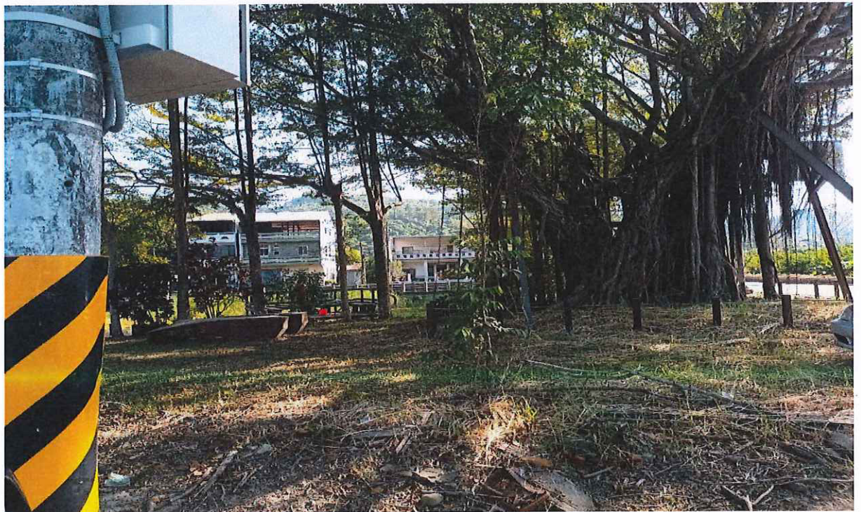
江家古厝旁老樹無影響