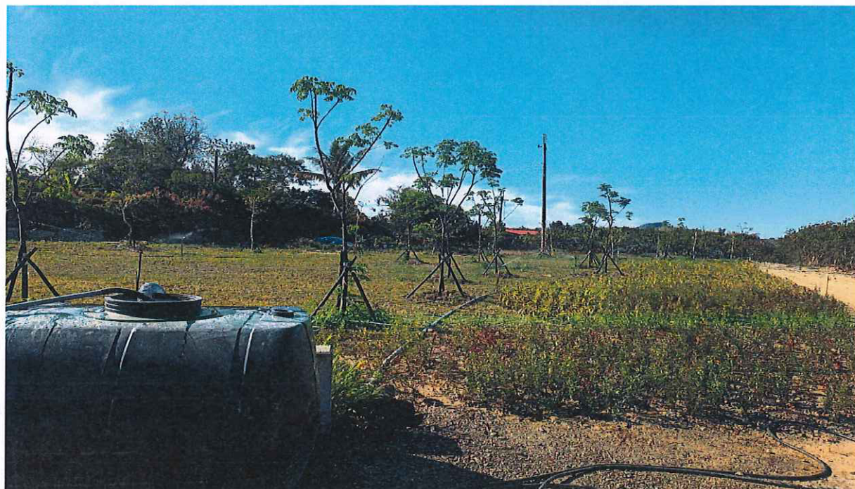
引道種植苗木及播撒草籽