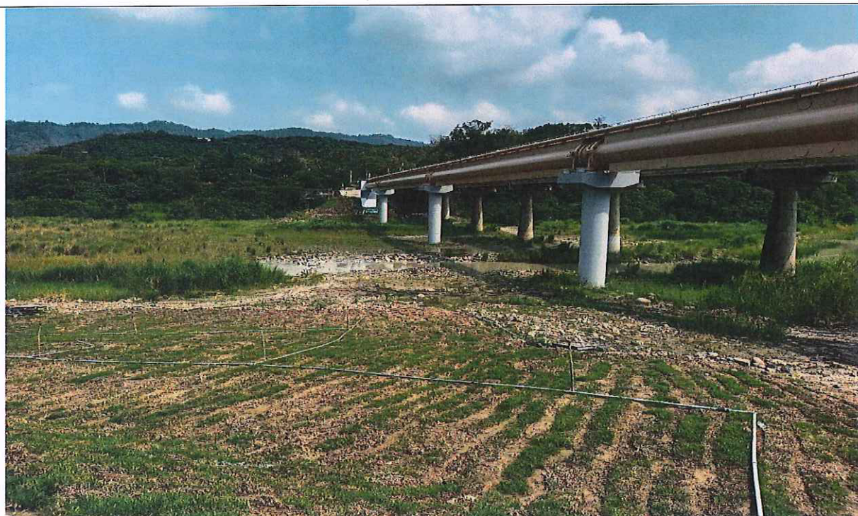
河道無完全阻斷水流