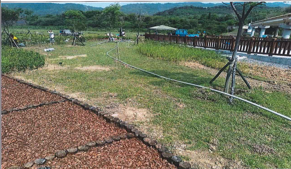
引道植栽定期灑水