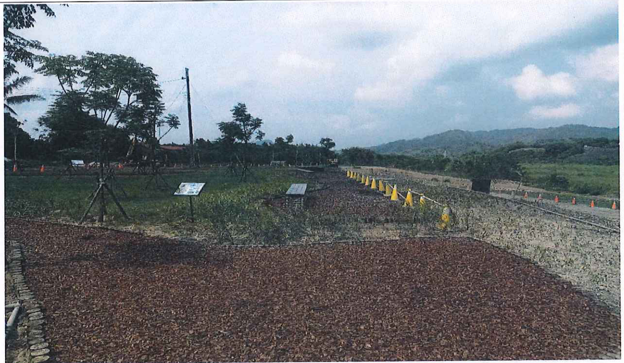
引道植栽定期灑水