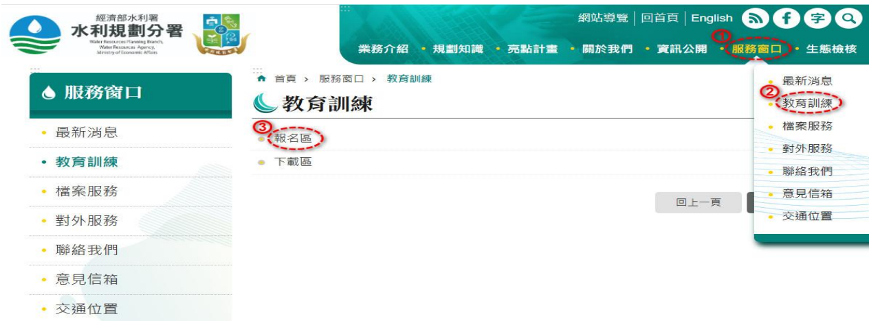
圖 3 水利規劃分署報名網頁