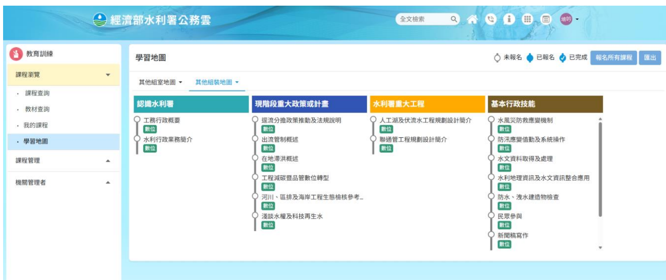
圖 5 數位課程學習地圖

二、 數位課程 ：請學員登入水利署公務雲( https://cloud.wra.gov.tw/ )，點選公務雲>教育訓練>課程瀏覽>學習地圖>其他組裝地圖>組裝地圖>基礎班(如圖 5)，進入報名。