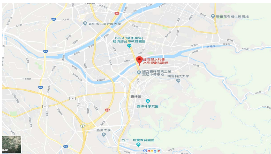
圖 1 水利規劃試驗所位置圖