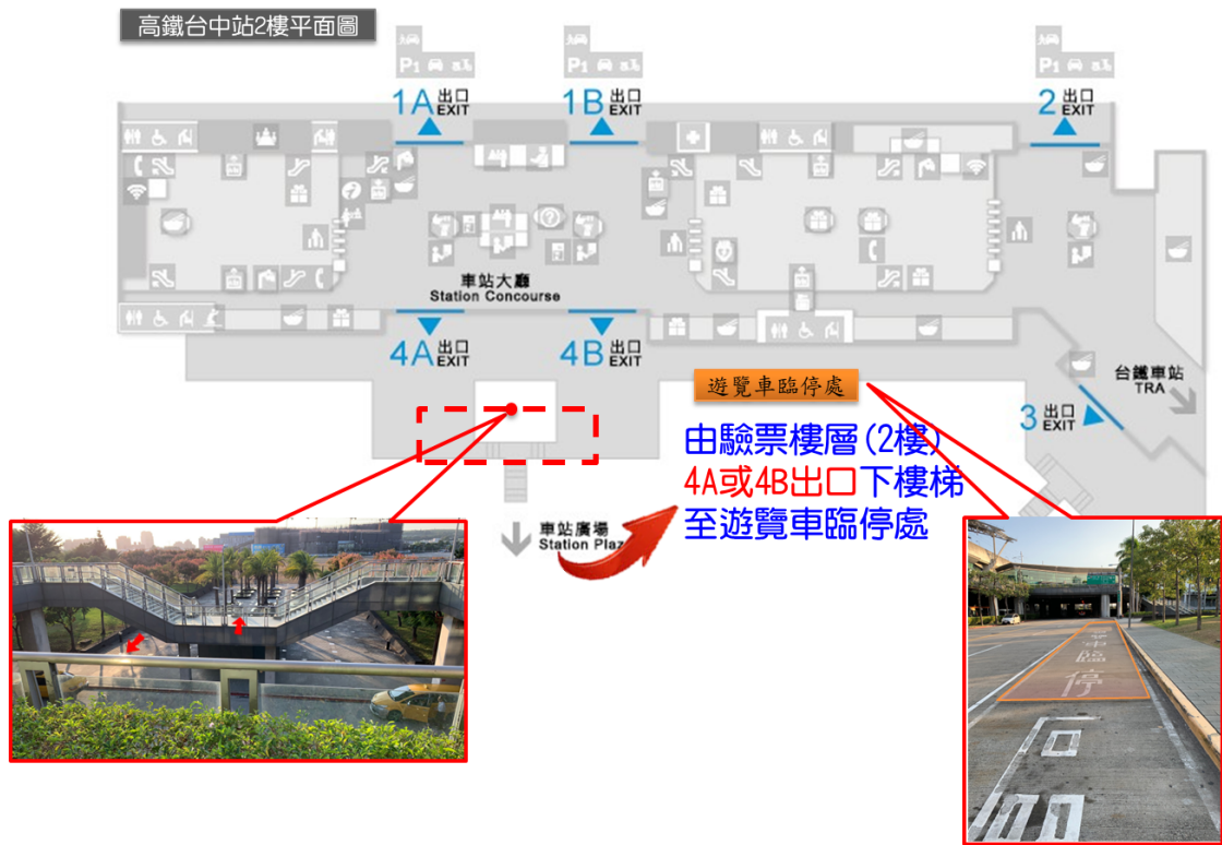
圖 2 高鐵台中站接駁位置圖