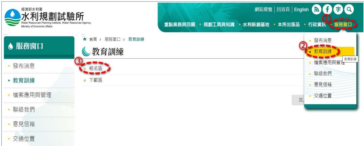
圖 4 水利規劃試驗所報名網頁