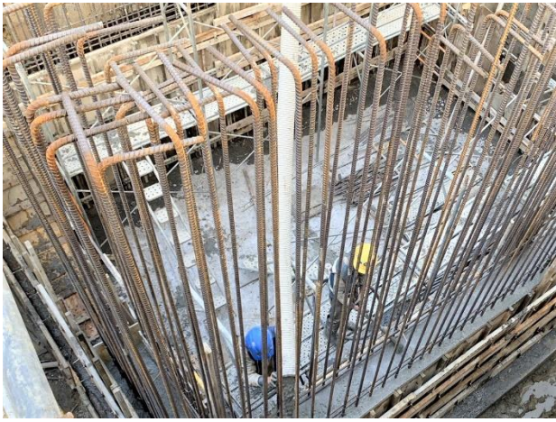
沙田水管橋： A1 可撓管窰井第一升層澆置