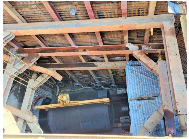
W57 工作井 → W56 工作井： 推進工程施作