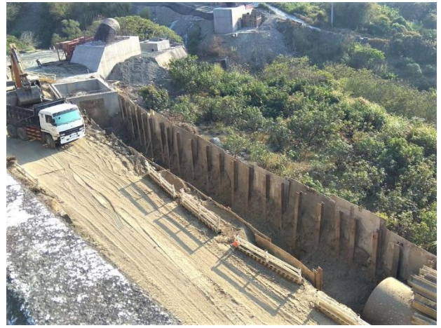
三埔水管橋 → 三埔段： 22k+373~22k+414.6 管溝開挖