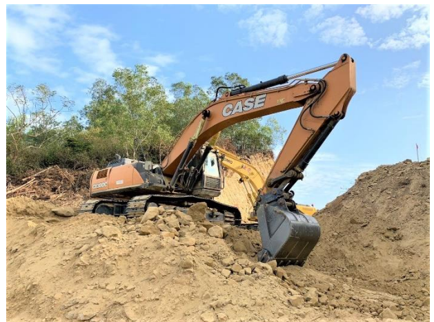
鏡面水庫消能池：破碎及出土