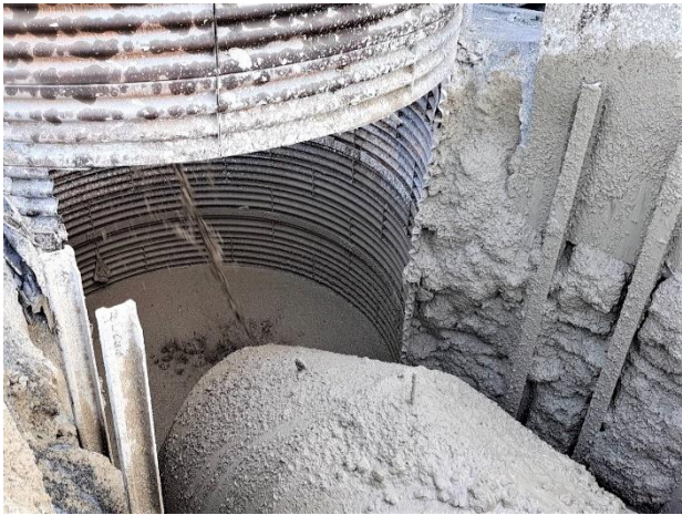
W51 工作井：工作井回填