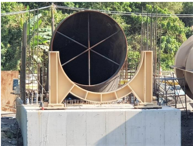
鏡面水庫水管橋： A2 固定環樑座吊裝