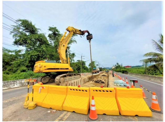
三埔段： 21k+990~21k+943 鋼軌樁拔除