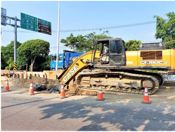
W39 工作井 → 中正段： 16k+726~16k+745 銜接區段開挖