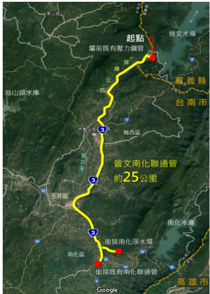
圖 1-1 曾文南化聯通管工程計畫

本計畫期程自 108 年起至 113 年止，總經費以 120 億元上限，計畫管路沿既有道路埋設，行經台南市楠西區、玉井區及南化區，全長約 25 公里，設計輸水能力為每日 80 萬噸，其中主管段（曾文電廠壓力鋼管至既有南化高屏聯通管北寮銜接點）及平壓管段（自既有南化高屏聯通管設平壓管至鏡面水庫）由經濟部水利署南區水資源局主辦，分管段（南化區四埔至南化淨水場之銜接管段）由台灣自來水股份有限公司南區工程處主辦。衡酌本計畫由機關辦理之工作內容、施工量能、工程區域、地理位置以及增加廠商競爭等因素，分為 A1、A2、A3 等三件標案，本案為「曾文南化聯通管統包工程 A3 標」，工程位置如圖 1-2 所示。