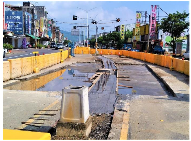
W44 工作井：中央分隔島施作