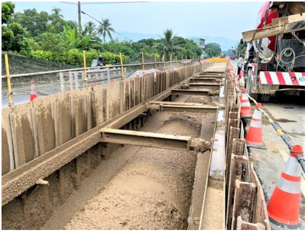
三埔段： 21k+836~21k+920 RMSM 回填