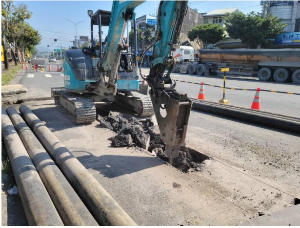
W42 工作井：預埋排氣管