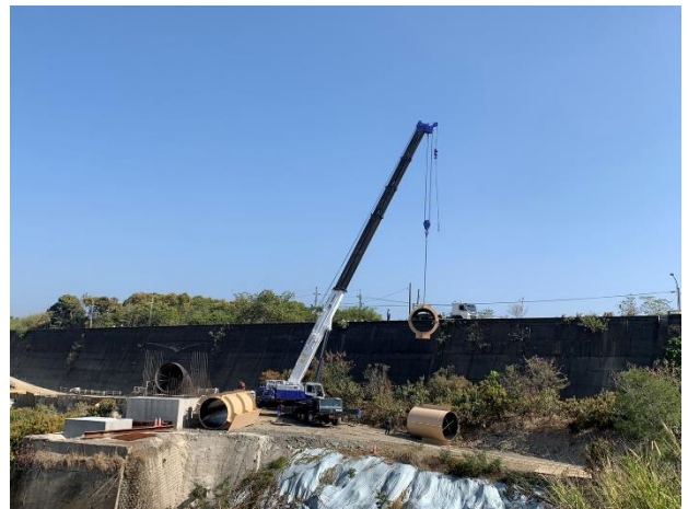
三埔水管橋：管樑進場