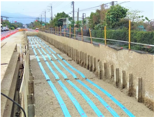
三埔段： 21k+579~21k+639 鋪設警示帶