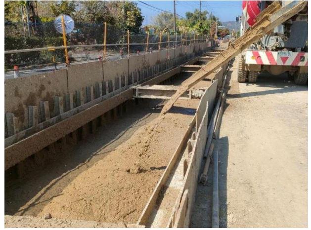
三埔段： 21k+579~21k+639 RMSM 回填