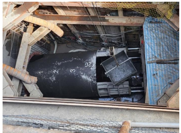
W57 工作井：推進作業施作