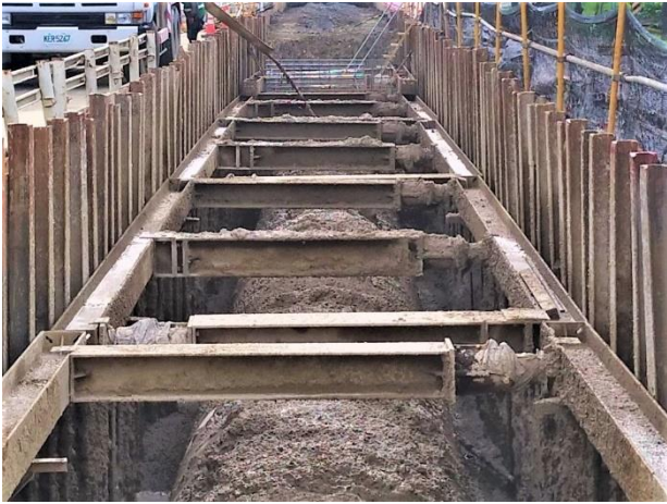
三埔段： 21k+707~21k+791 RMSM 回填