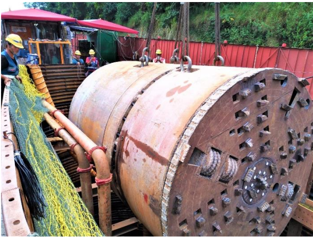
W52 工作井：推進設備安裝