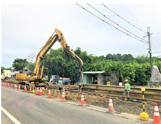
北寮段： 23k+987~24k+063 擋土支撐打設