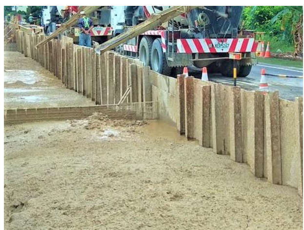
北寮段： 24k+063~24k+139 RMSM 回填