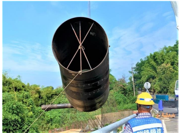
四埔水管橋：A1 橋台鋼管吊裝