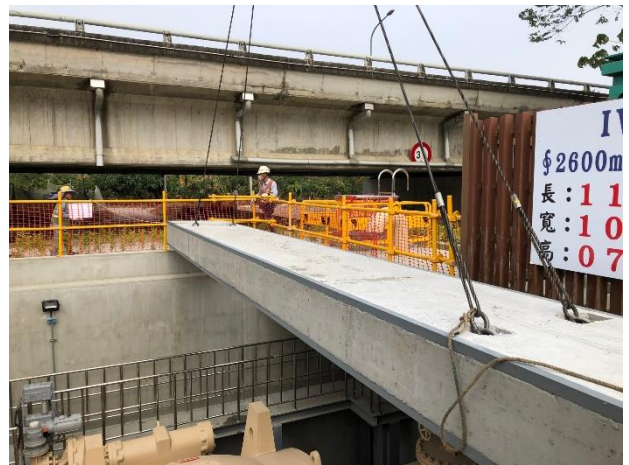
IV-11 球閥窰井蓋板施作