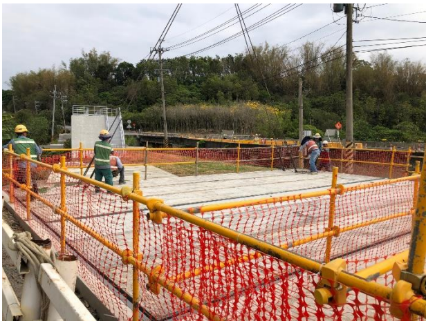
IV-10 球閥窰井蓋板施作