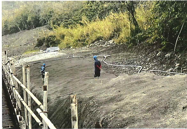
噴泥土固坡保護邊坡及樹種