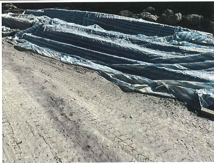
施工便道旁堆置材料