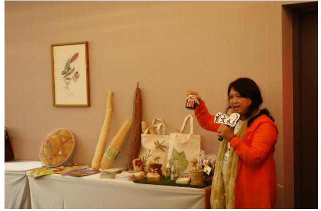
環教小市集 天埔社區