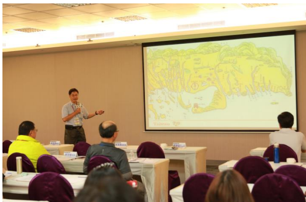
標竿案例交流分享 雲嘉南濱海風景區管理處