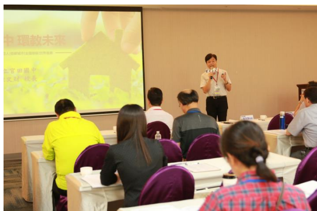
標竿案例交流分享 臺南市立官田國民中學