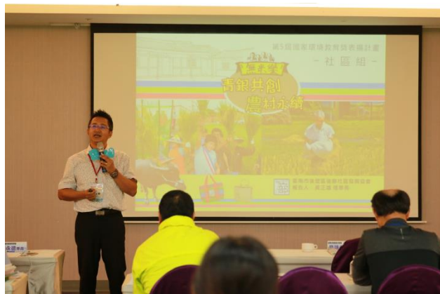
標竿案例交流分享 臺南市後壁區 後廊社區發展協會