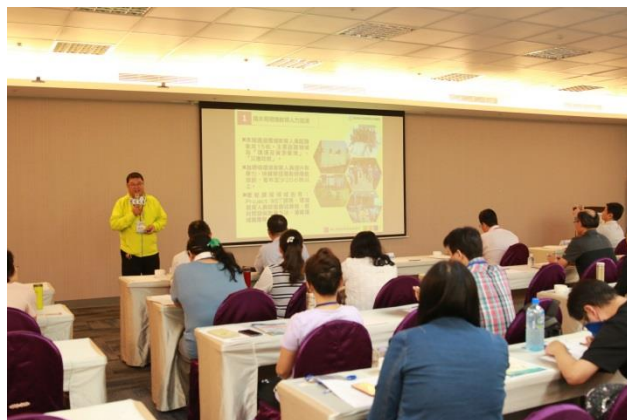
南水局環教執行分享