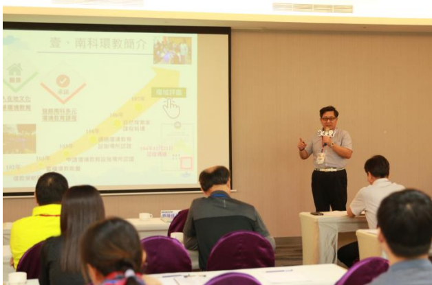
標竿案例交流分享 南部科學園區管理局