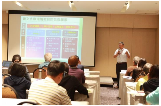
南水局環教執行分享