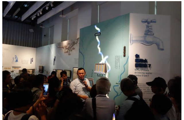
上午場--「誰主沉浮：水文化在臺灣特展」