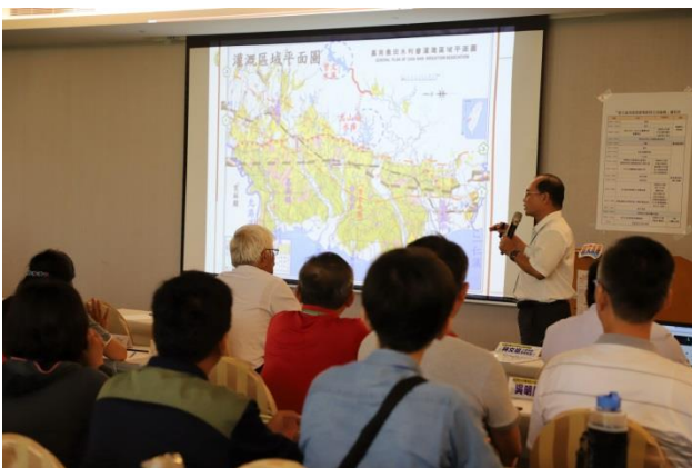
不毛之地變穀倉的嘉南平原 嘉南農田水利會