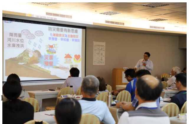
曾文溪流域智慧河川建置計畫 經濟部水利署 第六河川局