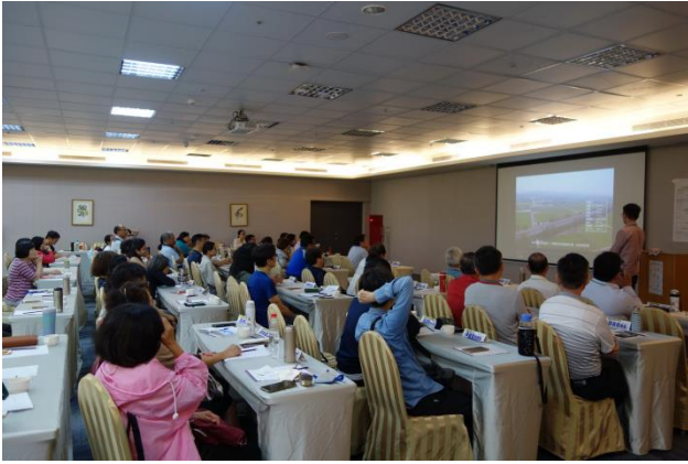
精進灌溉節水管理技術- 以嘉南灌區為例 中華電信數據通信分公司