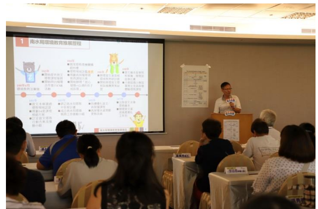
南水局環教執行分享