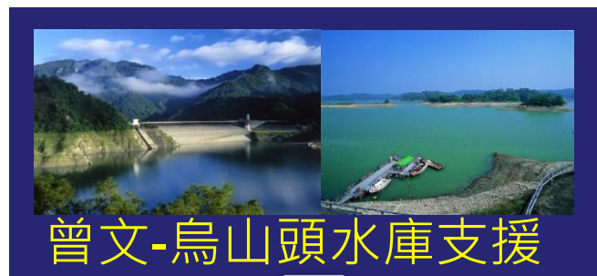
曾文-烏山頭水庫支援