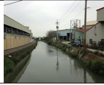
3、同安厝排水上游段