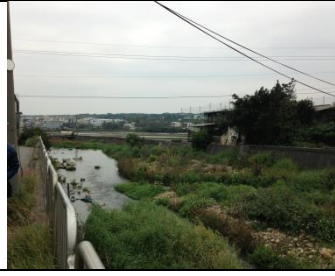
2、同安厝排水下游段