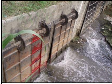
1、湖子內排水出口防潮水門