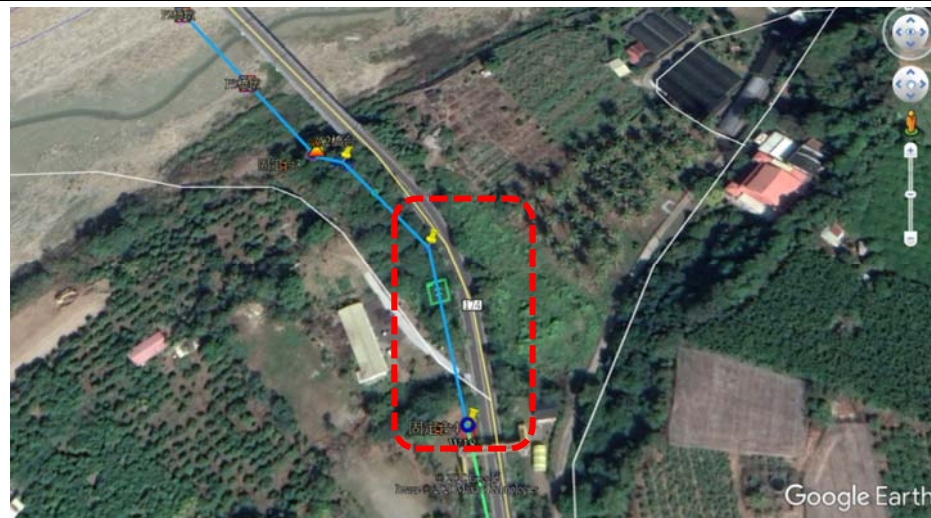
說明：A2 橋台至 W18 工作井明挖段