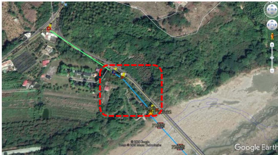
說明：W17 工作井至 A1 橋台明挖段