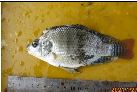
生物照-雜交吳郭魚