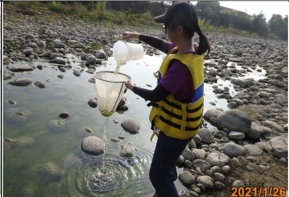
工作照-浮游動物採集