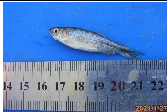
生物照-粗首馬口鱮