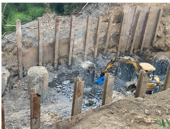
沙田水管橋：A1 橋台 樁頭打除