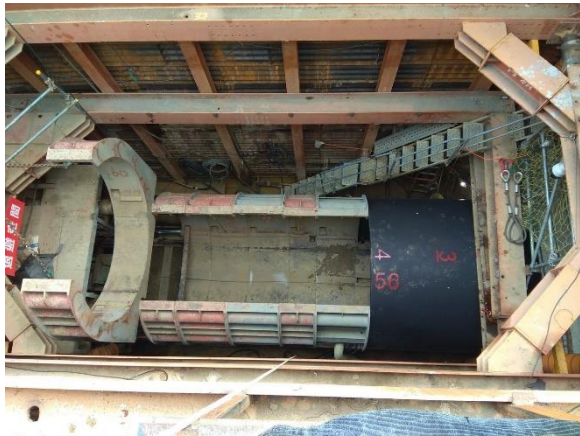
W43 工作井：推進工程施作