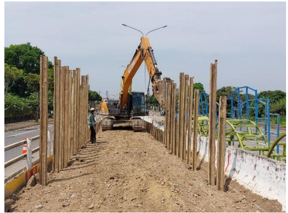
中正段：17k+135~17k+195 鋼軌樁打設