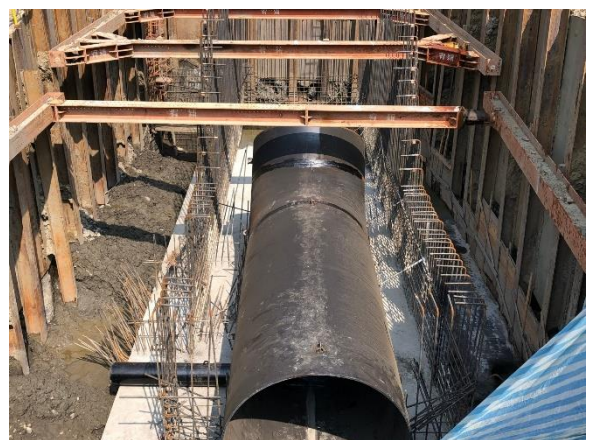
鏡面水庫水管橋：A2 橋台 鋼管銲接