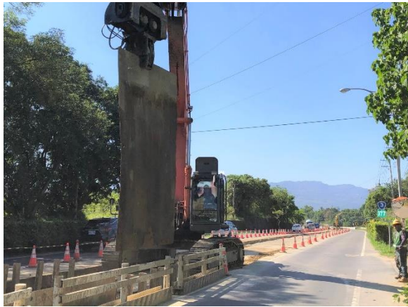
三埔段：21k+937~21k+997 擋土鋼板打設