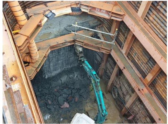
W43 工作井：推進設備拆除