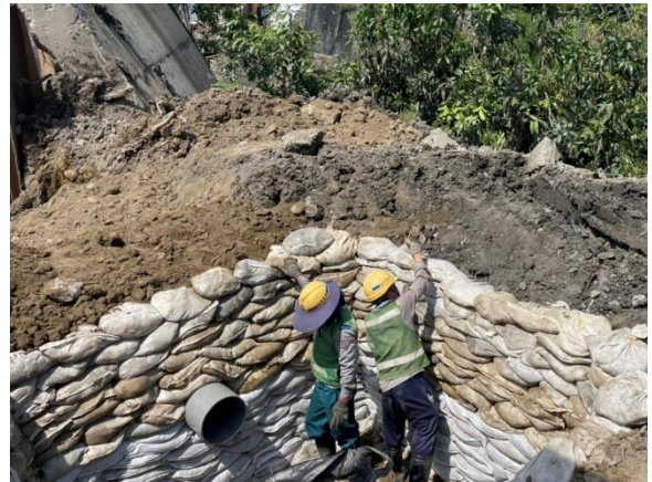
三埔水管橋：A1 橋台 水土保持設施作