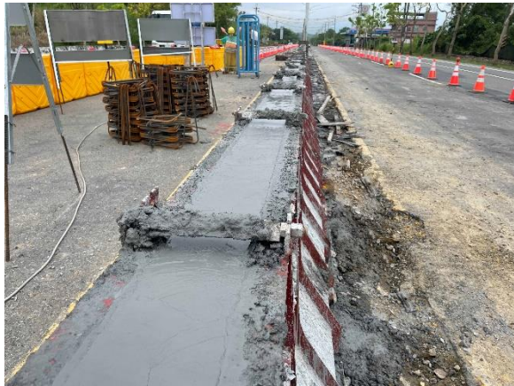
沙田段： 19k+605~19k+650 中央分隔島復舊