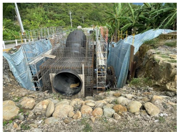
鏡面水庫水管橋：A1 橋台 第一升層施作