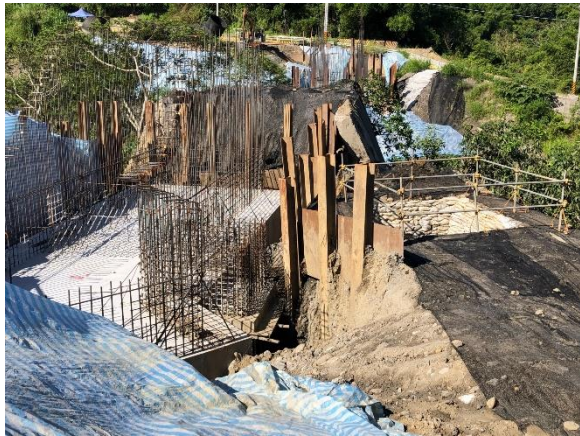
三埔水管橋：A1 橋台 水土保持設施施作