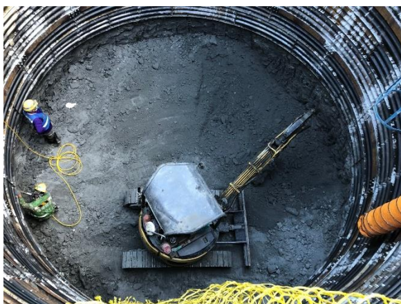
W53 工作井：工作井開坑作業