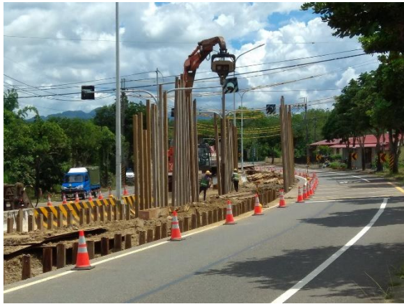
中正段：16k+830~16k+952 鋼軌樁打設