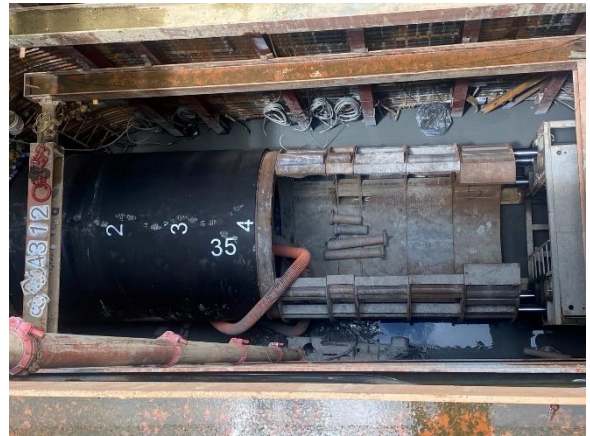
W52 工作井：推進工程施作