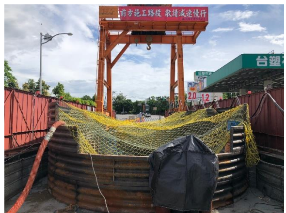
W57 工作井：推進設備安裝