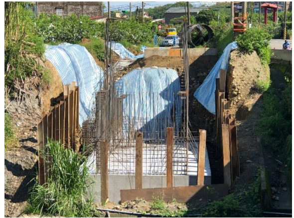
沙田水管橋：A1 橋台 水土保持設施施作