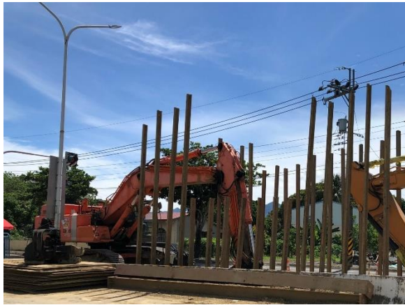
中正段：16k+830~16k+952 鋼軌樁打設