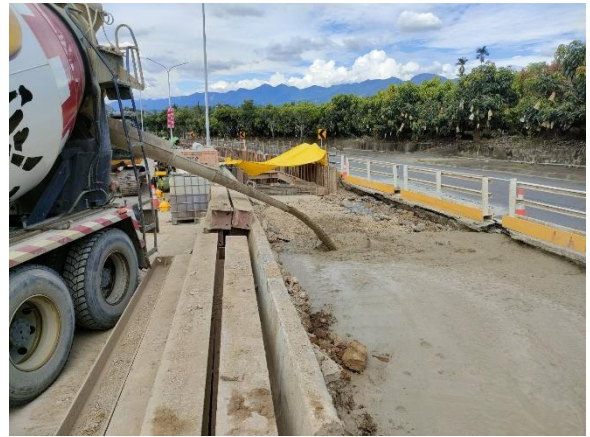
中正段：16k+952~17k+095 CLSM (工地型拌合) 回填