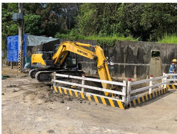
W51 工作井：工作井開坑作業