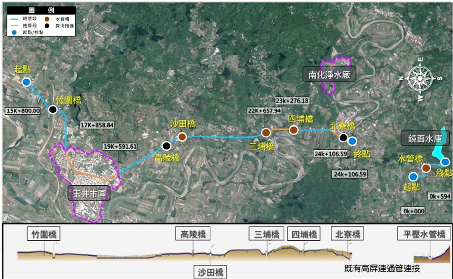
圖 1-1 工程位置圖 (A3 標)