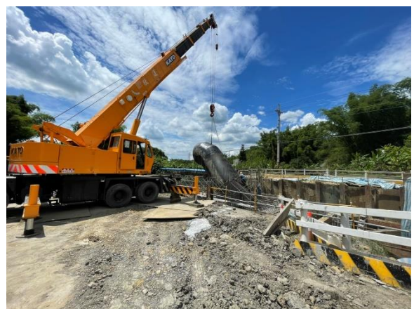
鏡面水庫水管橋：A2 橋台 鋼管吊裝