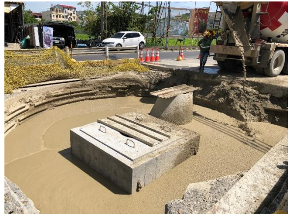
W42 工作井：工作井回填作業