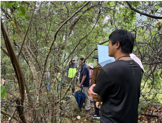
白冷綠世界發展協會介紹魚池過往情形