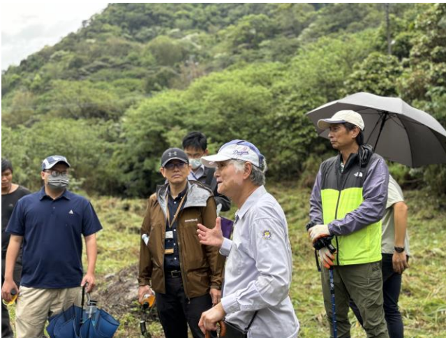
中橫交通觀光促進會發表意見