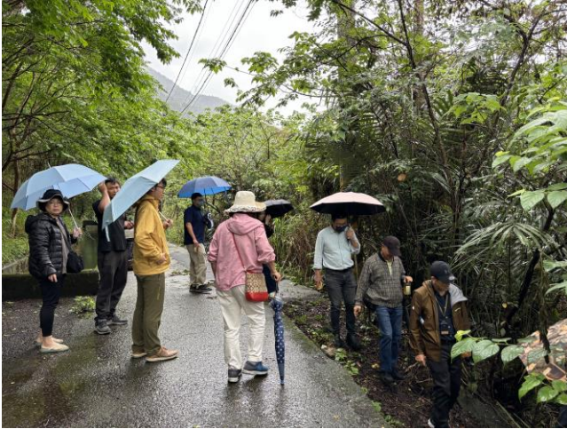
白冷圳旁有一前往既存魚池入口