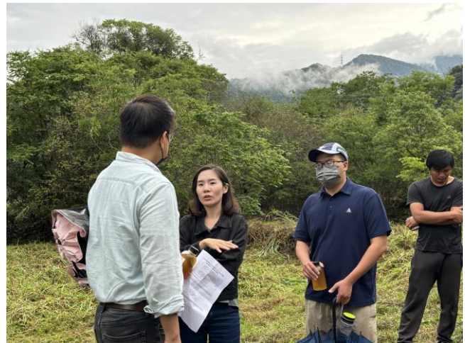
第三河川分署討論後續推動方式