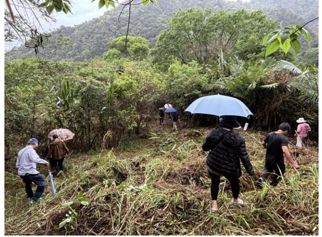
前往既存魚池的灘地