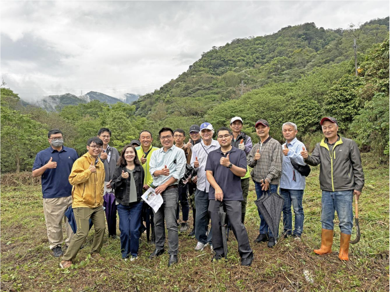
與會者開心於魚池旁合影