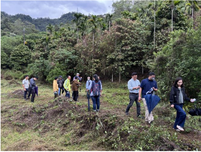
與會者行走於既存魚池塹堤