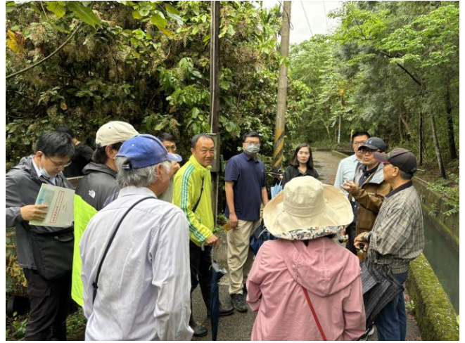
現勘尾聲於白冷圳旁進行總結