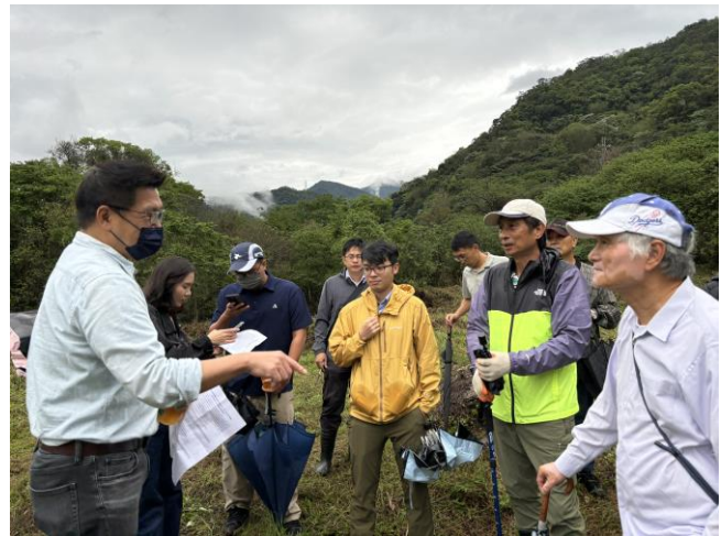
公私部門於既存魚池旁交流想法