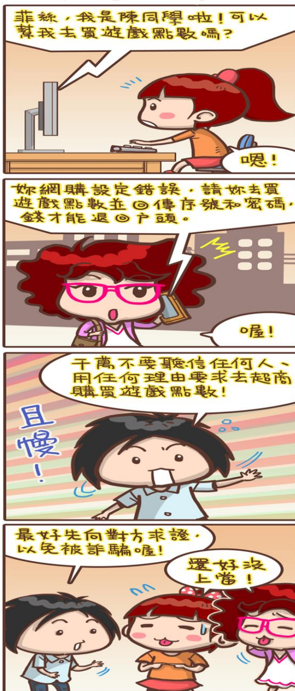
圖 水瓶女王vs老公仔