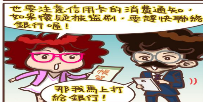
圖 水瓶女王vs老公仔