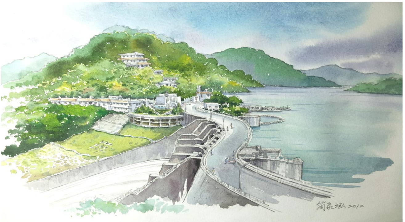
石門水庫