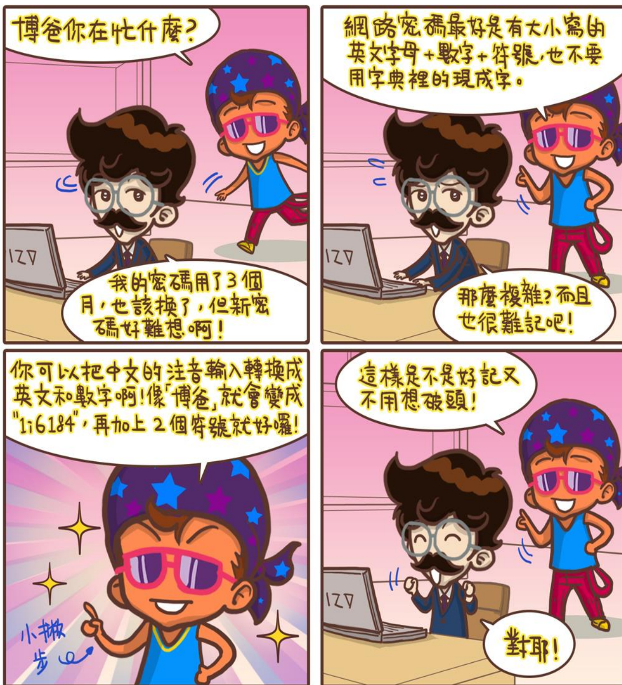
圖 水瓶女王vs老公仔