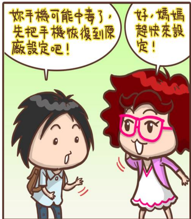
圖 水瓶女王vs老公仔