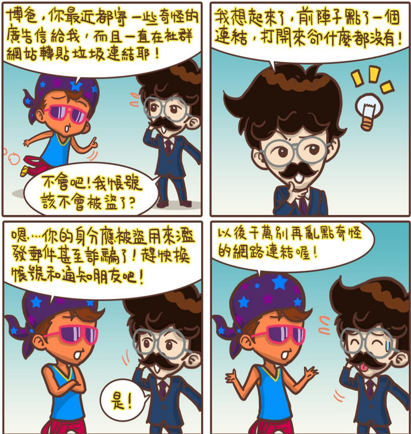
圖 水瓶女王vs老公仔