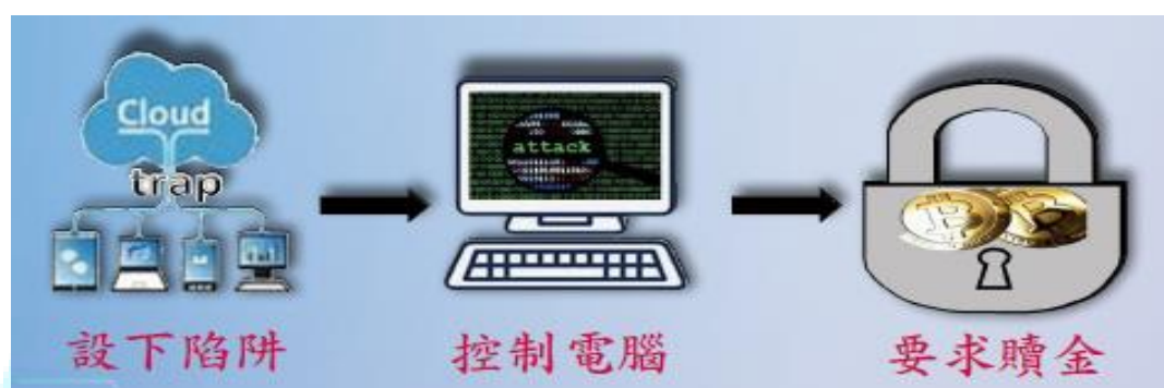
圖1 勒索軟體攻擊三階段

基本上勒索軟體攻擊主要有三個階段，如圖1所示，駭客會先設置惡意陷阱以潛入用戶電腦，俟偵測出用戶系統漏洞，匿名資料夾即自動執行取代原資料夾，將所有檔案加密，並出現要求支付贖金的通知訊息，用戶支付後才能取回檔案。