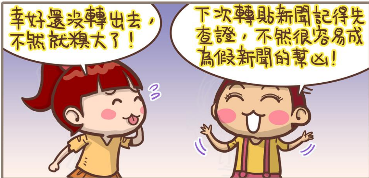
圖 水瓶女王vs老公仔