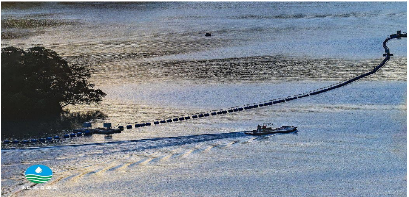
巡航(2018 石門水庫攝影比賽銅牌--姚其昌先生作品)