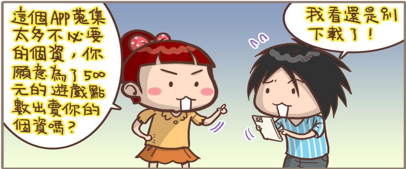
圖 水瓶女王vs老公仔