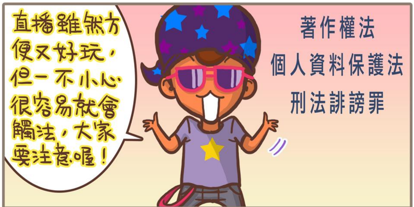
圖 水瓶女王vs老公仔