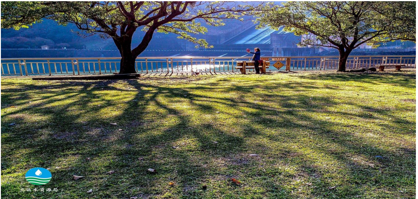
問斜陽 (2018 石門水庫攝影比賽優選獎--柯志勝先生作品)