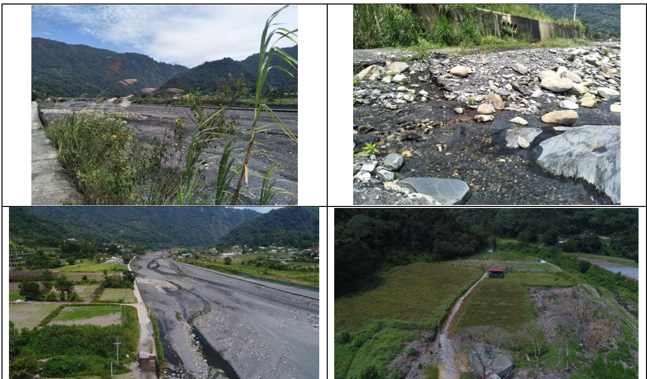
圖 4-126 濁水溪新武界橋下游左岸堤段(0+000~0+600)整建工程現況照

於 109 年 9 月 11 日現場勘查，溪流水質清澈，河道內由礫石組成，砂量低，水域型態大部分為淺流，已有護岸，岸邊向內陸延伸喬木群提供鳥類良好棲息空間，並由草生地、喬木群，少部分人為干擾及農地構成。現況如圖 4-126 所示。