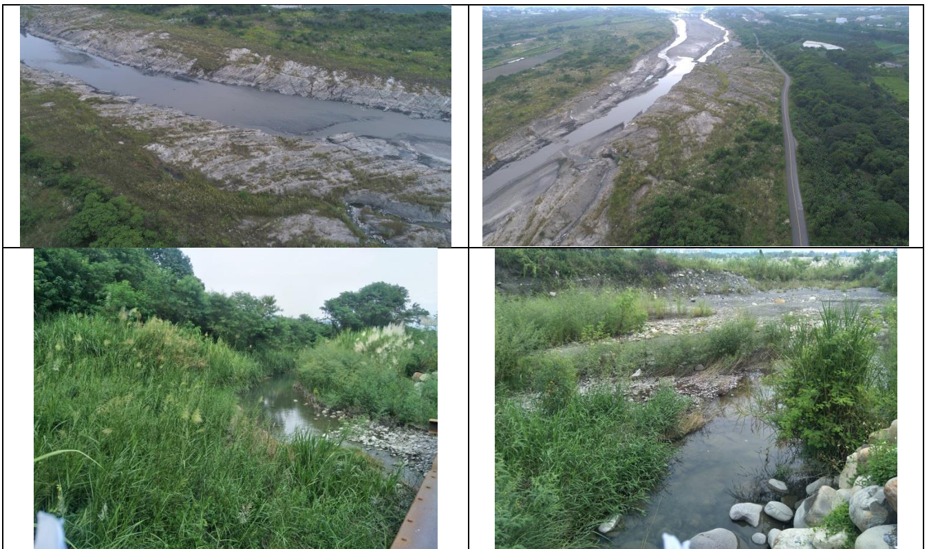
圖 4-134 濁水溪濁水、社寮、富州等堤防(斷面 105~114)整建工程現況照

於 109 年 9 月 9 日現場勘查，鄰近河道兩側為陡峭岩石峭壁，向兩側延伸為草生地，左岸腹地較右岸大，故植被茂密並形成次生林，右岸則有部分人為開闢道路，道路兩側喬灌木群分布，再向外延伸則是以農地、住家分布，於現勘發現小支流匯入主流，水質清澈，目視可見小型魚類活動。現況如圖 4-134 所示。