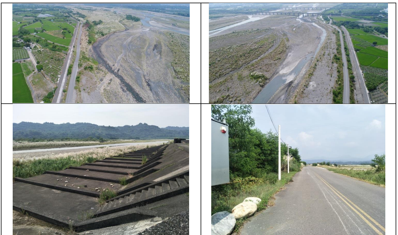
圖 4-132 濁水溪濁水低水護岸(斷面 87~105)整建工程現況照

於 109 年 9 月 9 日現場勘查，堤內大部分皆為農地，零星住家分布，堤外由灘地、草生地組成，於河道內灘地多已覆蓋芒草，裸地頻率較下游出海口灘地少見，便道兩側有零星銀合歡成株生長。現況如圖 4-132 所示。