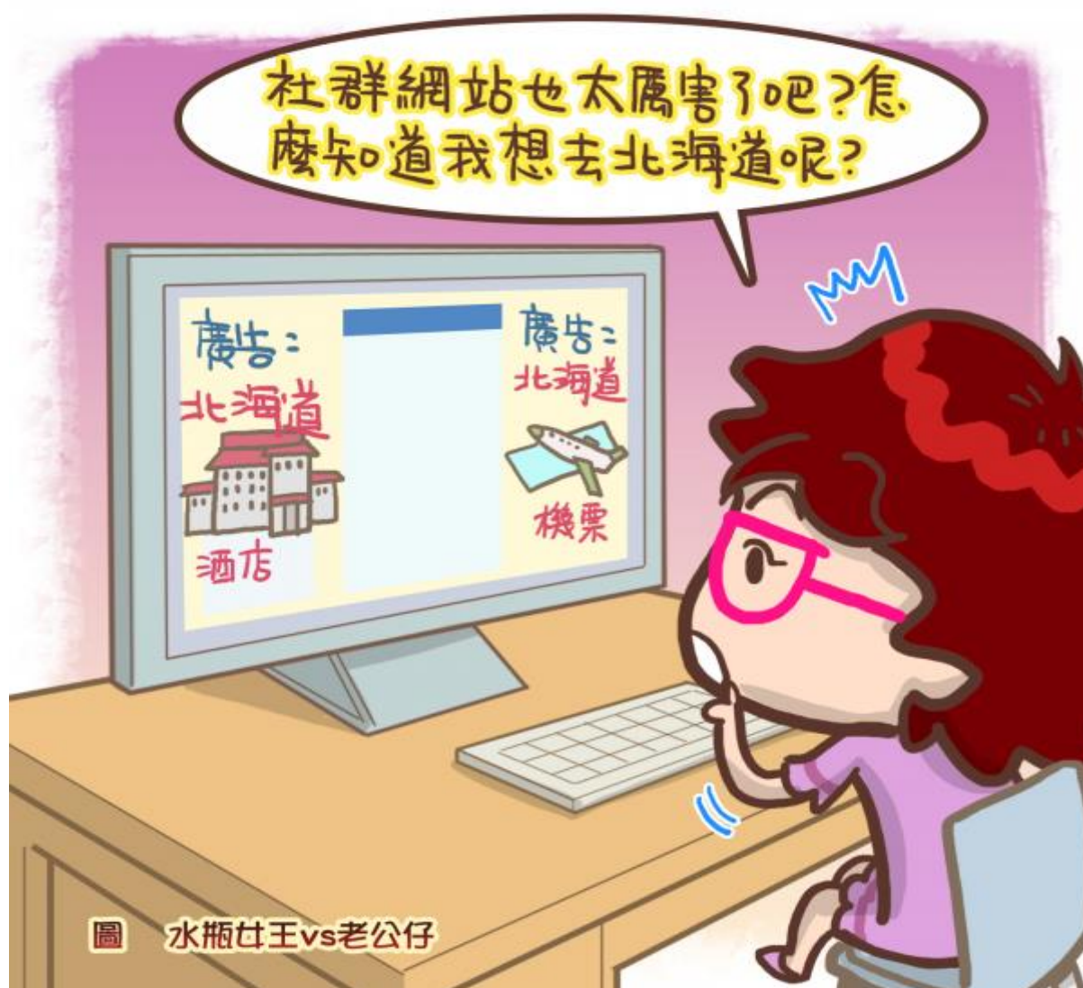
圖 水瓶女王vs老公仔

我們在網路上從事的所有活動或行為都會留下紀錄，這些紀錄稱為「數位足跡」，因此，當我們在網路上分享任何資訊，或是搜尋任何資料時，都要有心理準備，屬於自己的個人隱私資訊正在對外公開。