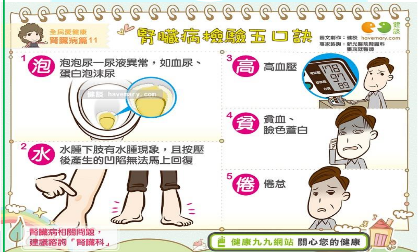
【圖：腎臟病檢驗五口訣】

值得注意的是，腎臟傷害是有累積性的，一旦腎功能受損將很難完全恢復至完全健康的狀態。建議慢性病患者積極控制病況，儘早戒菸並定期進行健康檢查，以免延誤診治。