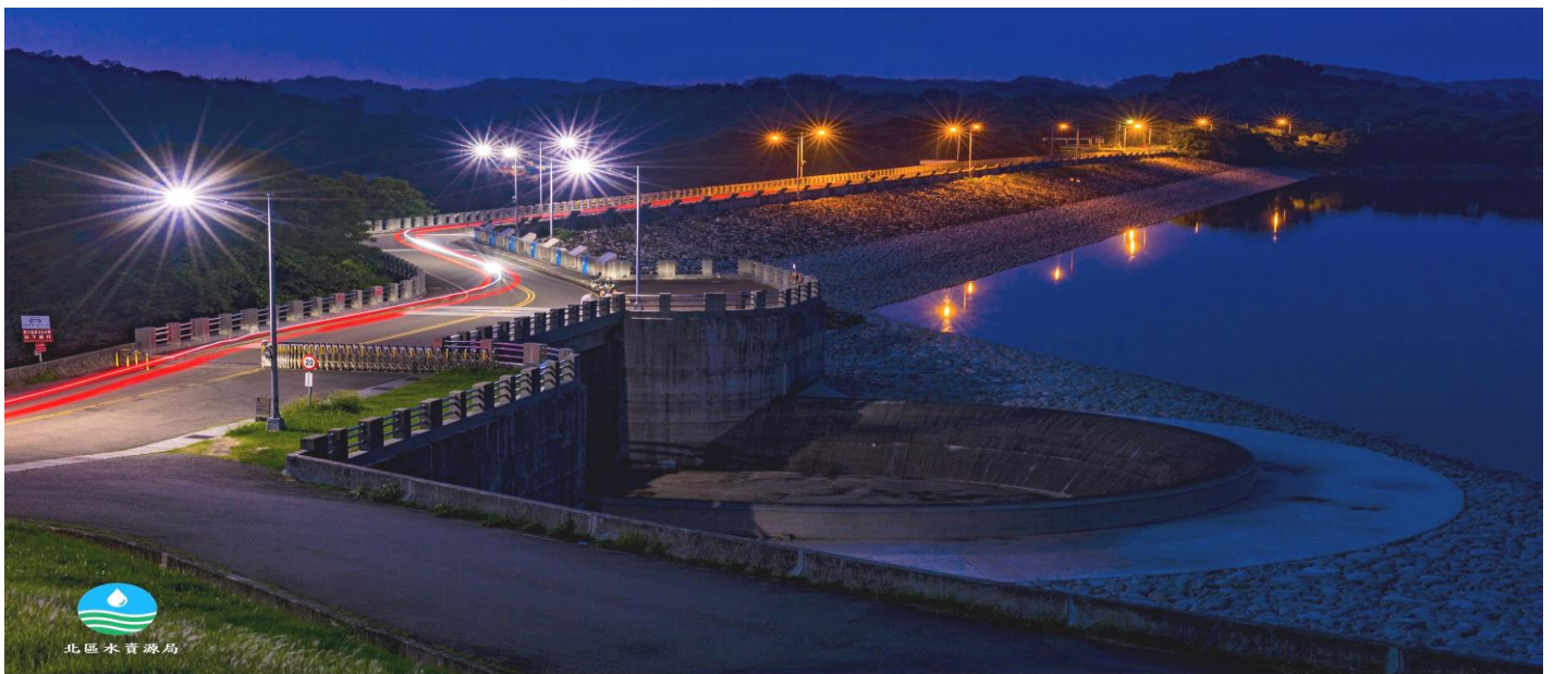
壩頂夜色 (2018 寶山第二水庫暨隆恩堰攝影比賽銀牌 得獎人：劉東海先生)