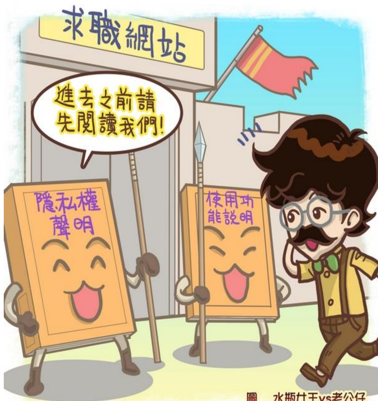
圖 水瓶女王vs老公仔

透過求職網站尋找工作非常方便，但在使用上需多加留意，應先詳細閱讀網站對於保護隱私權的聲明和使用功能說明，才不會有曝露個人資料的風險喔！