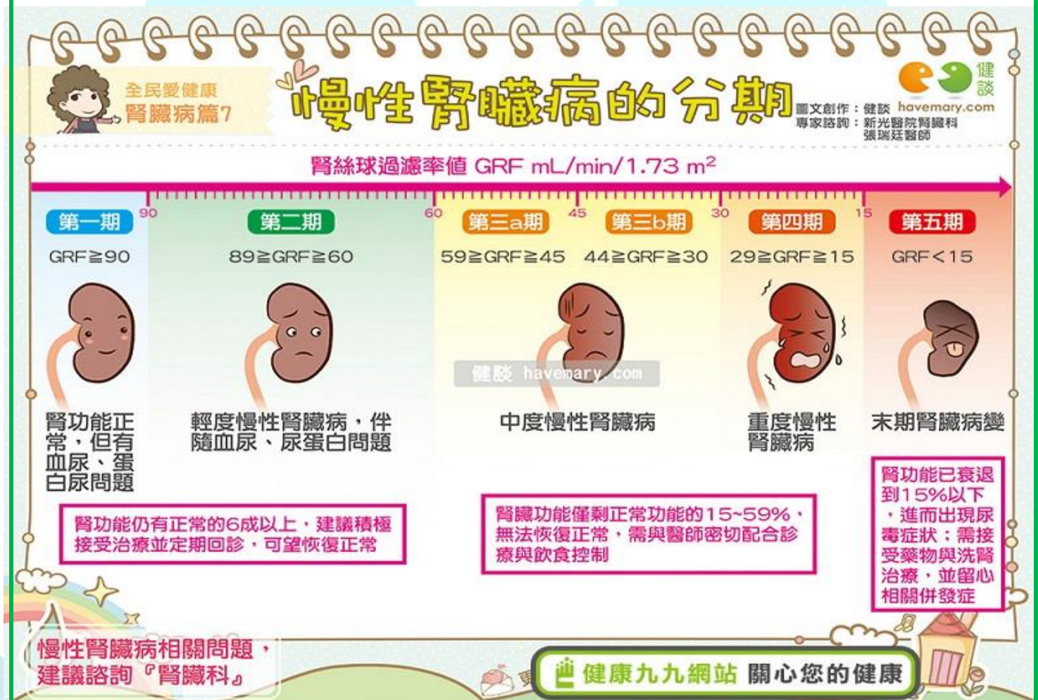
【圖：慢性腎臟病的分期】