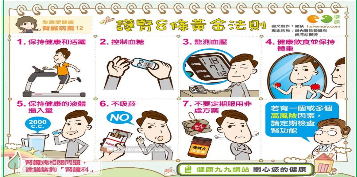
【圖：護腎8條黃金法則】