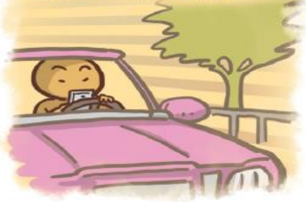
邊開車或騎車邊滑手機