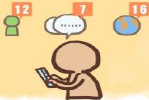
隨時上網確認是否有新訊息或新動態