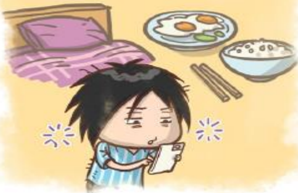
為了上網而廢寢忘食