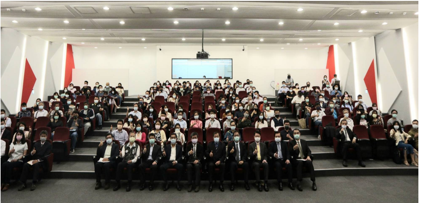
110年4月13日「開放政府動起來 廉政平台來相挺」成果發表暨座談會