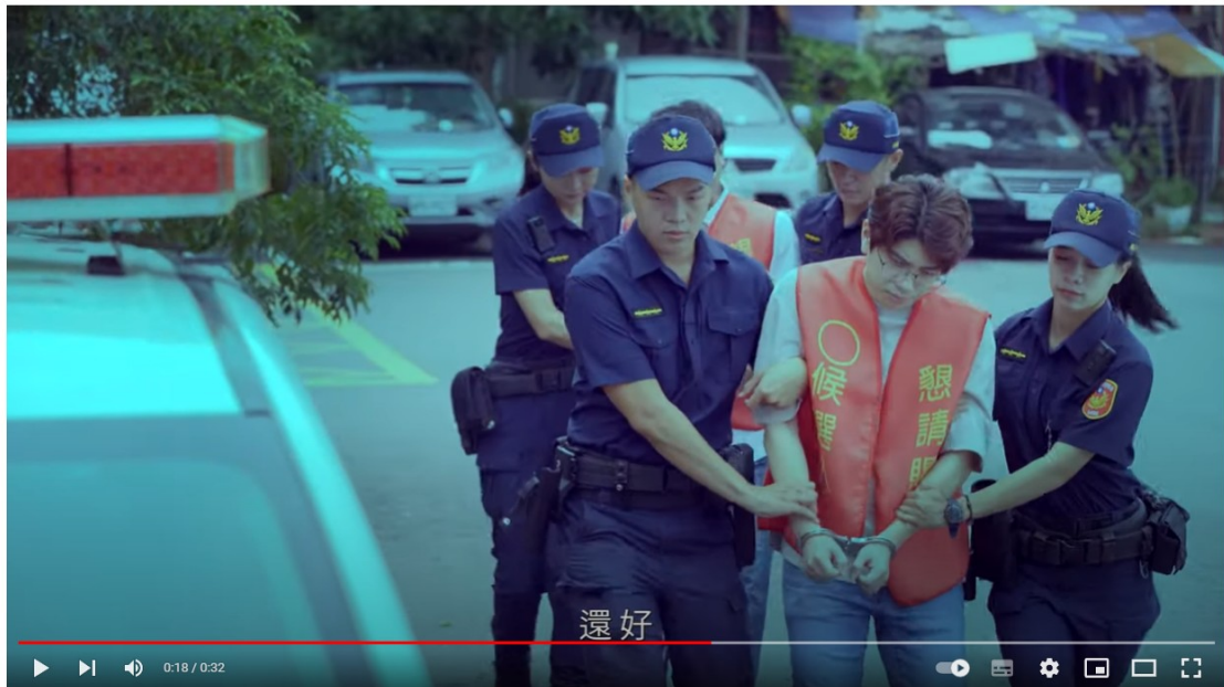
#反賄選 #法務部 111年度地方公職人員九合一選舉反賄選影片-父愛篇(國語版)

「父愛篇」以年輕父親為主角，面對敗壞的選風，挺身檢舉，留給孩子清廉、公平的未來，獲得青壯世代的共鳴。