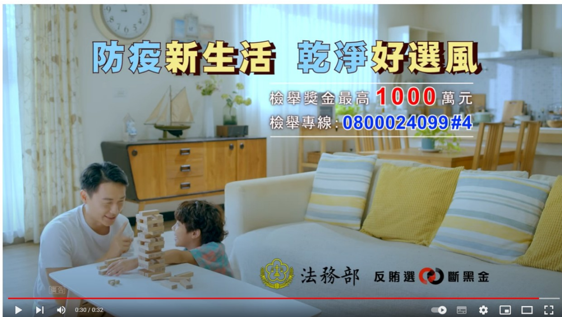
#反賄選 #法務部 111年度地方公職人員九合一選舉反賄選影片-父愛篇(國語版)