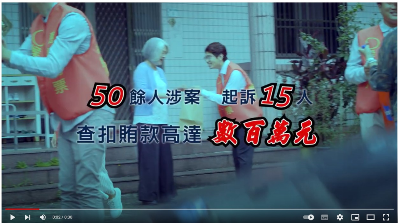
法務部反賄選 決心篇國語版

「決心篇」由檢察官擔綱主演，重現辦案經過，並宣示檢、警、調、廉團結一體的查賄決心。