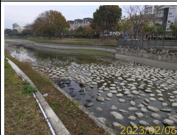
第五區放乾後現況