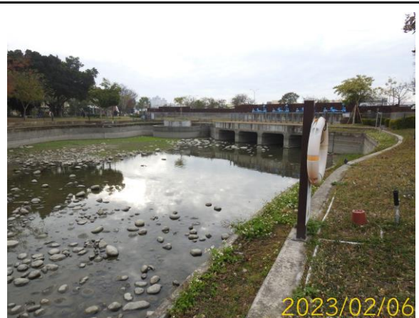
第五區放乾後現況