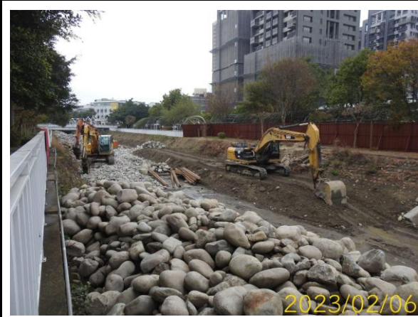
於第三區之取水口下游之施工情況