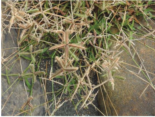
圖 2 生長於石縫間的龍爪毛