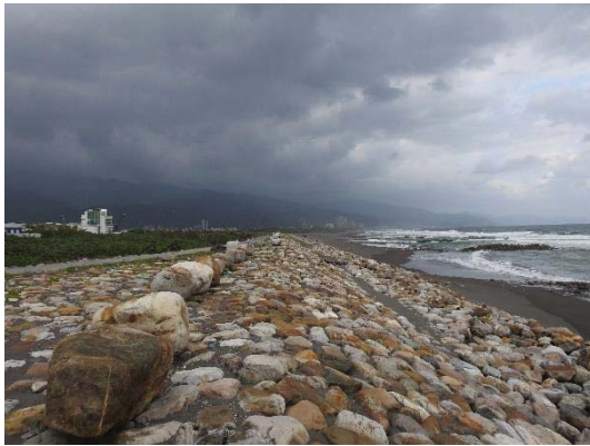
拋石包埋入沙灘段海岸