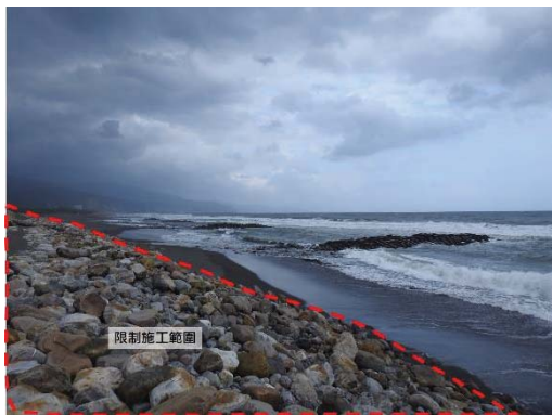
圖 3 預計施作工程範圍環境現況