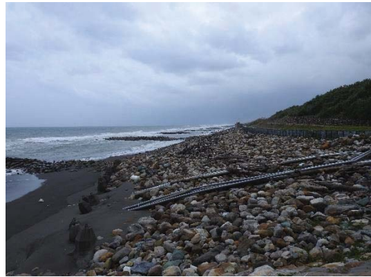
拋石相互堆砌形成孔隙段海岸