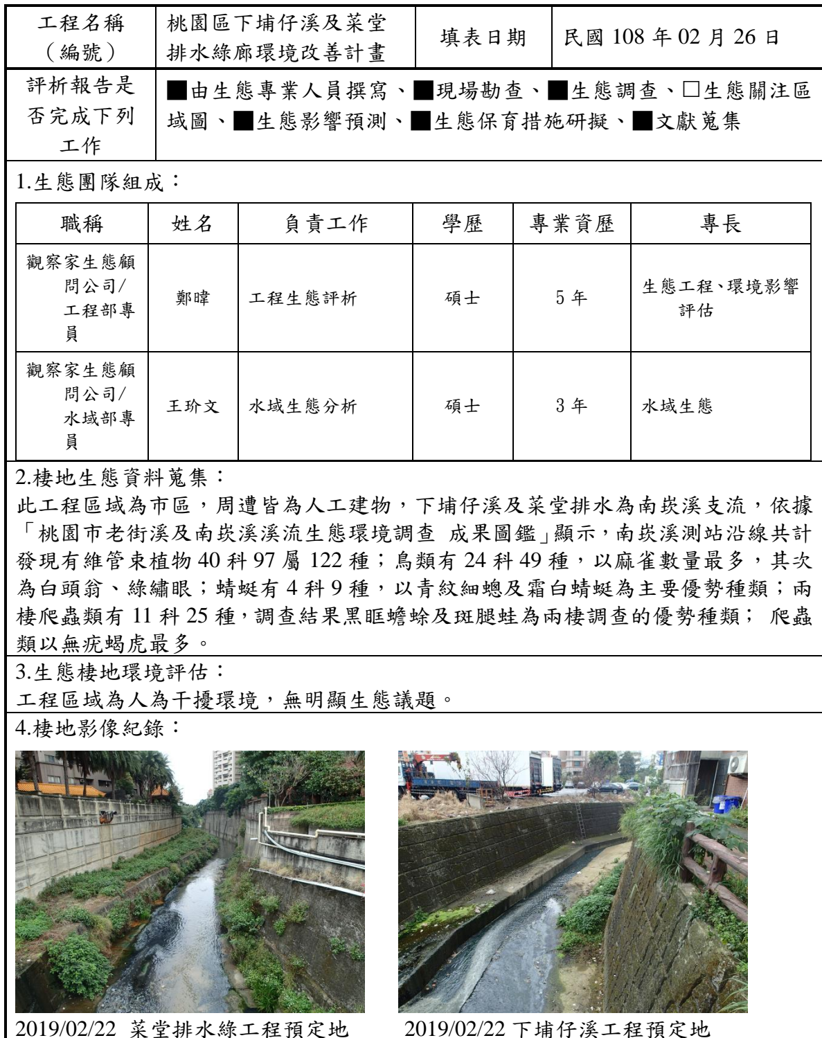
附表 D-03 工程方案之生態評估分析