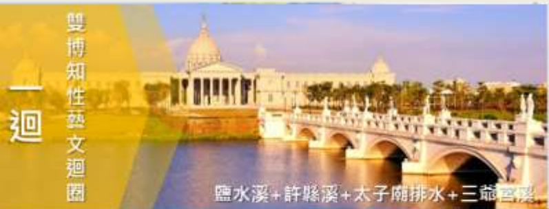
雙博知性藝文迴圈