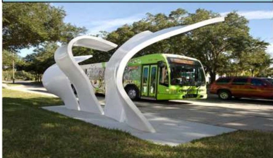
主題候車亭、街道傢具設計

港濱歷史公園景觀優化工程 :以自然線條及海洋意象為設計主軸，傳達港濱歷史公園意象風情，兼具景觀美化與休閒遊憩功能。