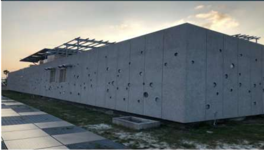
公 廁 造 型 外 牆 現 況