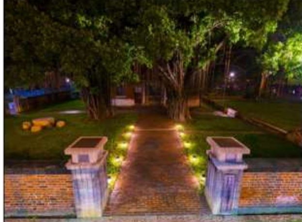
維悅廣場/圖騰『漩渦』