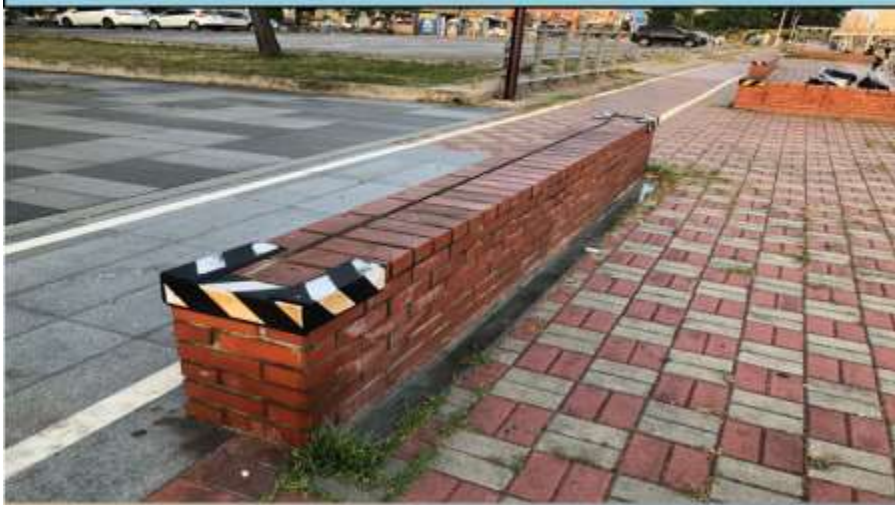
遊 憩 碼 頭 廣 場 現 況

遊憩碼頭廣場優化: 廣場舞台及座椅區照明：提供必要性燈光照明供活動使用，強化使用之安全性。