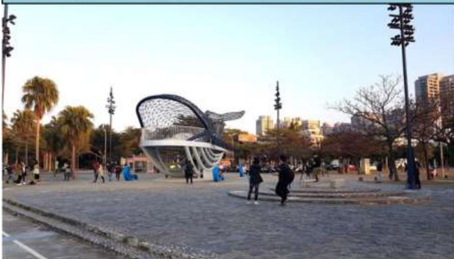
港濱歷史公園景觀現況