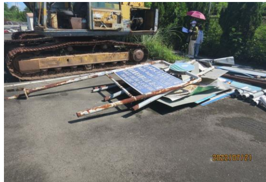
編號14-K26、K27 大小告示牌一批