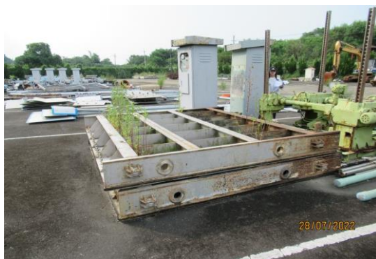
編號36-J57 水閘門2座、手動單桿吊門機8台、不鏽鋼螺桿8支、鋼索式吊門機2台、吊門機2台、不鏽鋼梯桿4支、控制箱2座