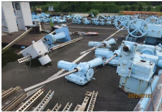
編號29-J1 螺桿吊門機3組