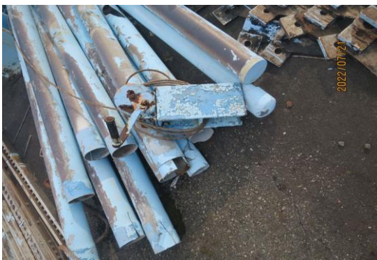
編號29-J1 手動簡易捲揚機1組