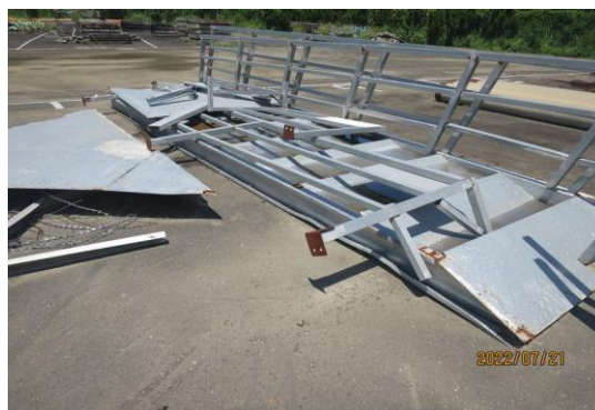
編號7-K39 舊鐵架一批、塑膠水管 (現場清點追加)