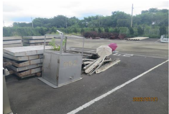
編號27-H62 油壓管5支、鐵閘門13片、木閘門2 片、亞鐵管1支、廢材一批(2鐵1鋁)