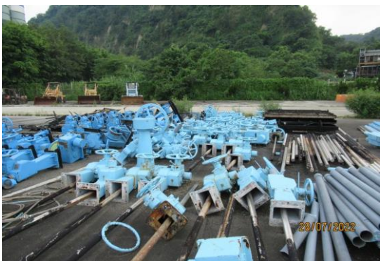
編號54-K60 水門機體零件

手動吊門機64組、梯桿64支(4組分離)、捲揚機17組、白鐵水門31片、白鐵欄杆6組、塑膠管64支