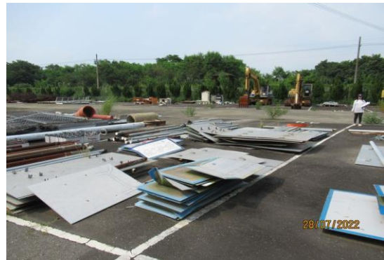
編號34-K7、K12 標示牌1批、鐵管、鐵夾一堆、凸透鏡一個