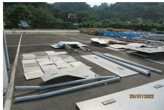
編號35-K17、K28、K34 標示牌3組、大告示牌、小告示牌、鐵管