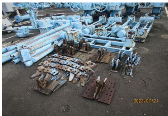
編號29-J1 水門吊耳: 雙片14座、單片36片