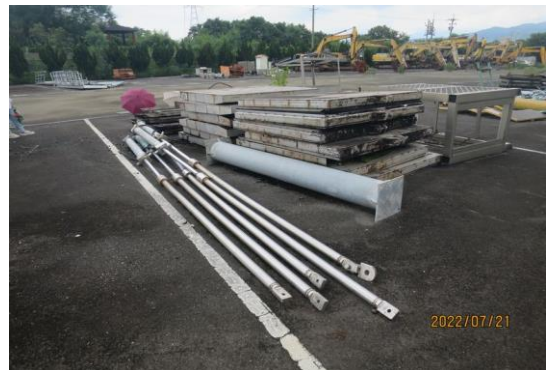
編號27-H62 油壓管5支、鐵閘門13片、木閘門2 片、亞鐵管1支、廢材一批(2鐵1鋁)