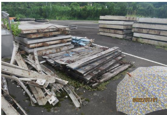
編號27-H62 油壓管5支、鐵閘門13片、木閘門2 片、亞鐵管1支、廢材一批(2鐵1鋁)