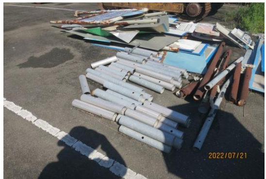
編號14-K26、K27 大小告示牌一批