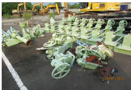
編號38-K24 雙桿吊門機10台、單桿吊門機12台、 欄杆1批、鐵管21支、塑膠管7支