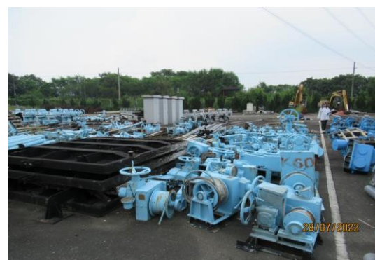
編號54-K60 水門機體零件