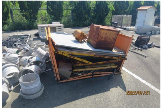
編號9-K2 廢鐵一批(現場清點追加)