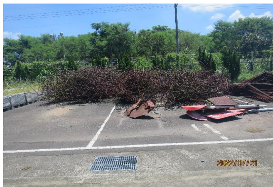
編號3~5-K6、K19、K36 廢鐵、鐵條、告示牌4片