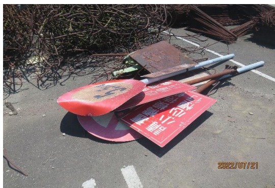
編號3~5-K6、K19、K36 廢鐵、鐵條、告示牌4片