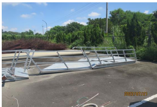
編號7-K39 舊鐵架一批、塑膠水管 (現場清點追加)