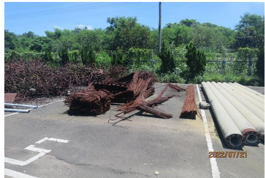
編號3~5-K6、K19、K36 廢鐵、鐵條、告示牌4片