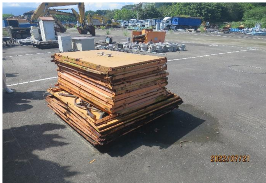
編號8-K30 抽水機外殼鐵片一批