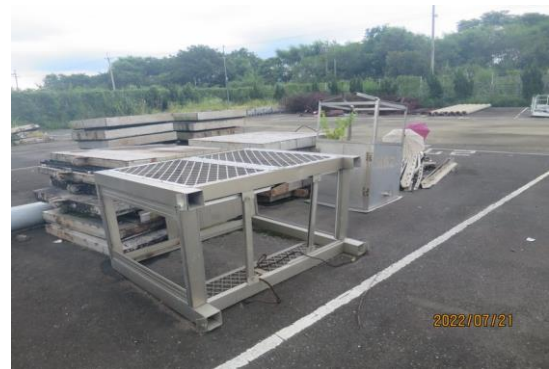
編號27-H62 油壓管5支、鐵閘門13片、木閘門2 片、亞鐵管1支、廢材一批(2鐵1鋁)