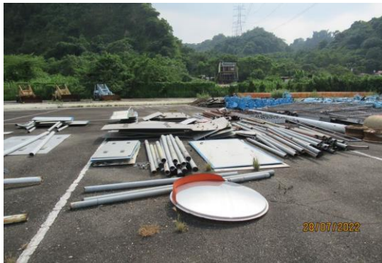
編號34-K7、K12 標示牌1批、鐵管、鐵夾一堆、凸透鏡一個