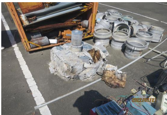
編號9-K2 抽水零件一批