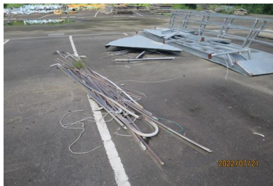
編號7-K39 舊鐵架一批、塑膠水管 (現場清點追加)