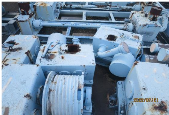
編號29-J1 省力型單桿吊門機4組