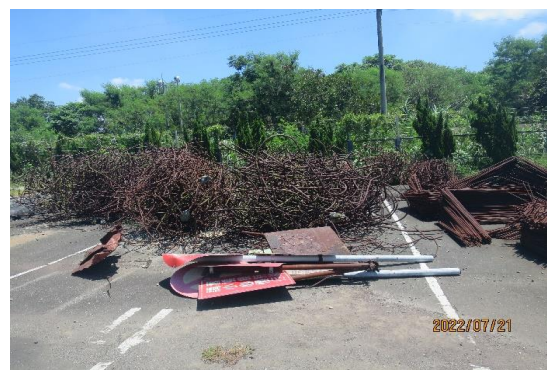
編號3~5-K6、K19、K36 廢鐵、鐵條、告示牌4片