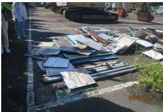
編號14-K26、K27 大小告示牌一批