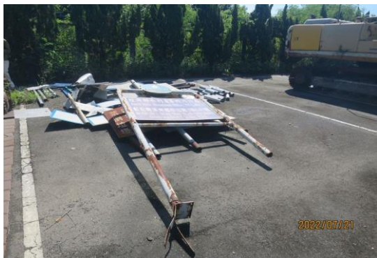
編號14-K26、K27 大小告示牌一批