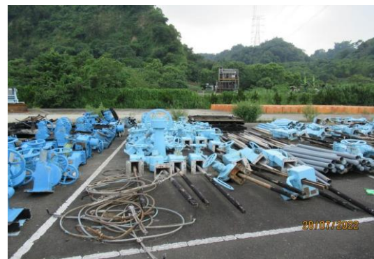
編號54-K60 水門機體零件