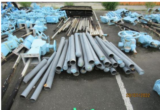
編號54-K60 水門機體零件