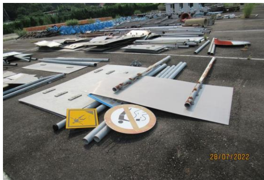
編號35-K17、K28、K34 標示牌3組、大告示牌、小告示牌、鐵管