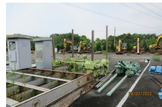
編號36-J57 水閘門2座、手動單桿吊門機8台、不鏽鋼螺桿8支、鋼索式吊門機2台、吊門機2台、不鏽鋼梯桿4支、控制箱2座