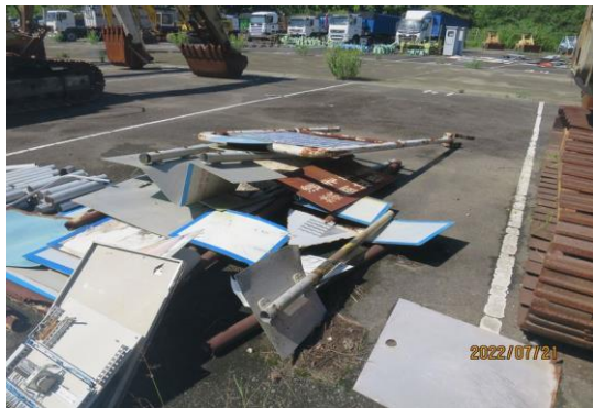
編號14-K26、K27 大小告示牌一批