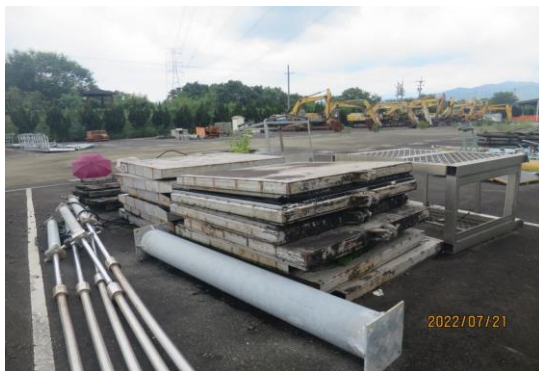
編號27-H62 油壓管5支、鐵閘門13片、木閘門2 片、亞鐵管1支、廢材一批(2鐵1鋁)