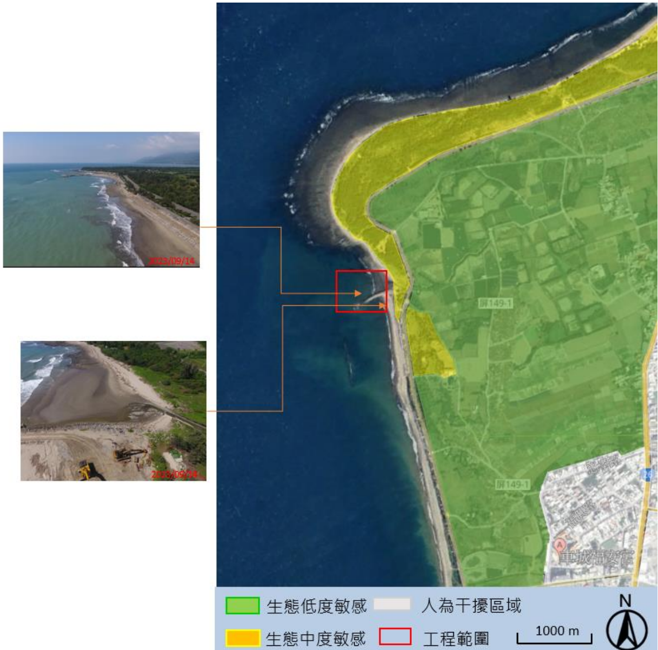
福安宮北側海岸生態關注區域圖

一、 本案工區位於福安宮北側海岸，工區主要位於近海部分，較遠處除次生林劃設為中度敏感區外，其餘較遠地區種植劃設為低度敏感區，生態關注區域圖如下：