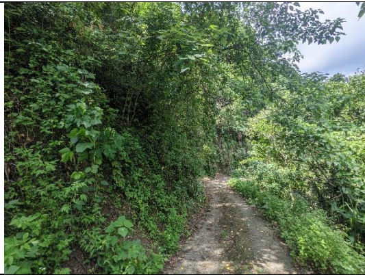
計畫範圍現況 拍照日期：110 年 7 月 19 日