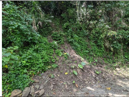
邊坡現況 拍照日期：110 年 7 月 19 日