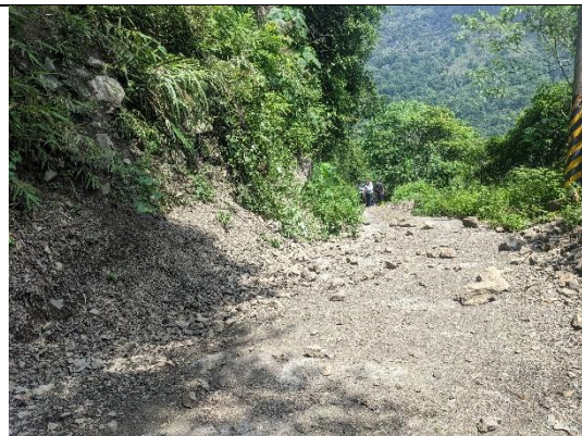
計畫範圍旁的道路 拍照日期：110 年 7 月 19 日