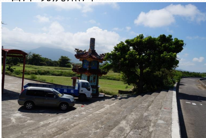
右岸-保安宮現況照片