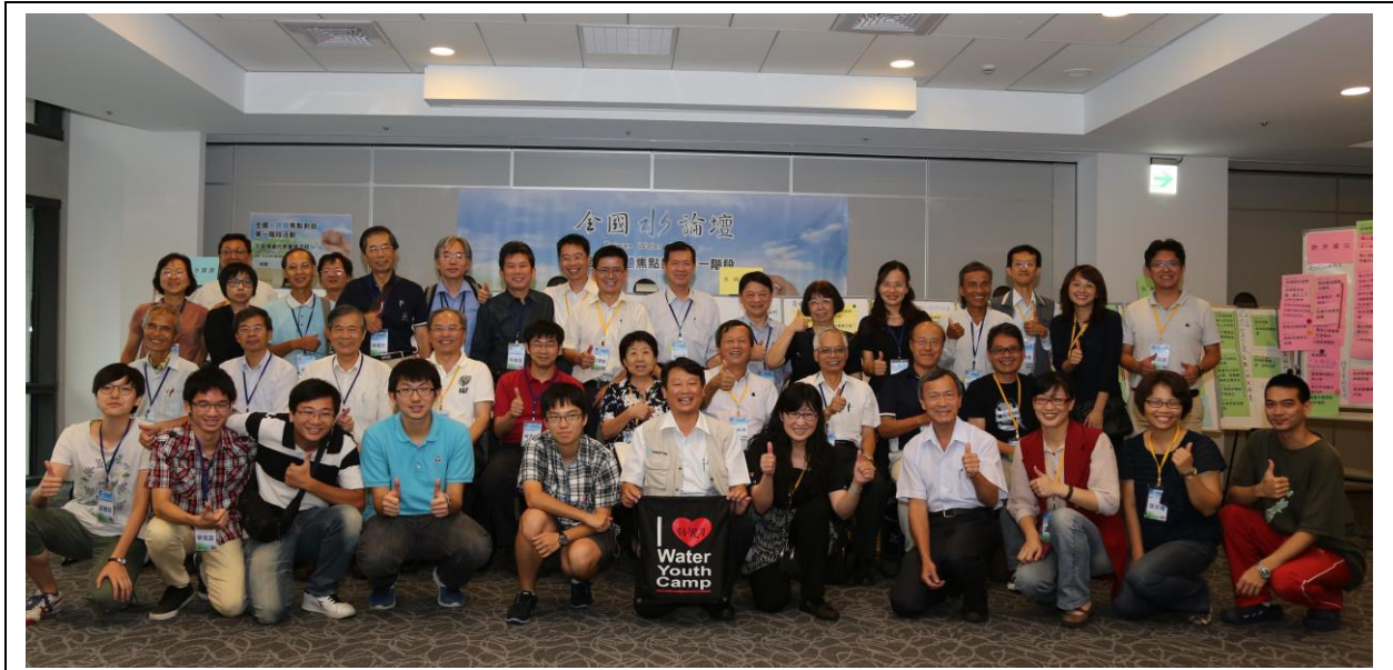
全國水課題焦點對話第一階段北區場次合影留念，感謝與會來賓共襄盛舉