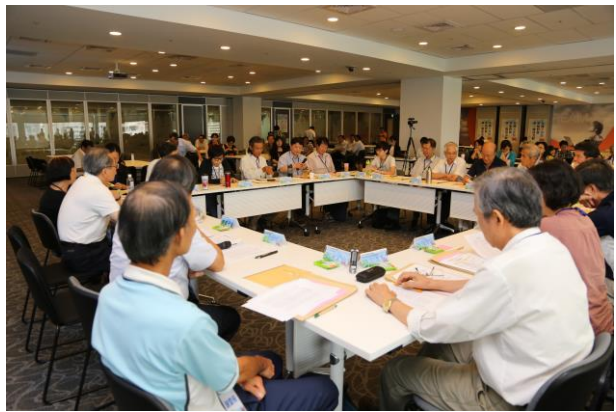
各桌推派之桌代表參與桌代表會議，同時開放與會來賓旁聽