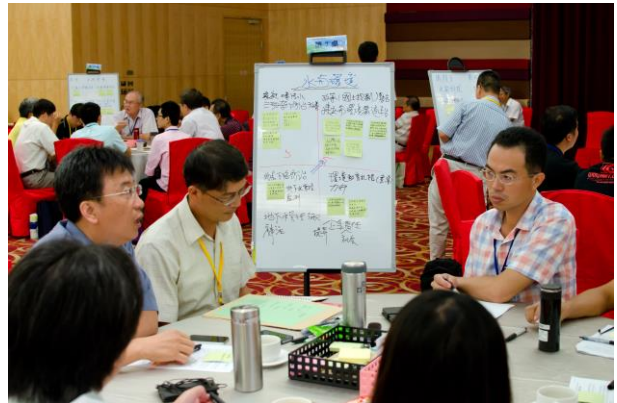
分組討論：桌員說明對此面向之看法，並與其他桌員討論(第7桌-水與環境)