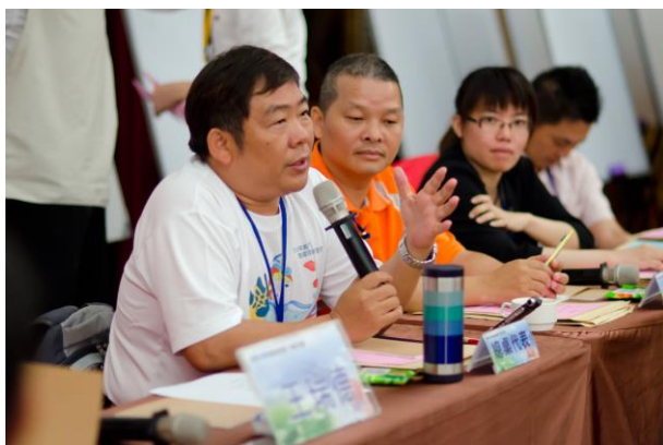
由桌代表投票選出綠色協會魯台營理事長作為南東區場次為總桌代表