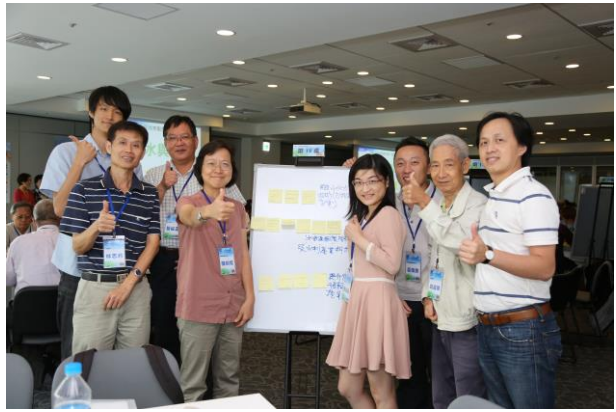
分組合照：桌員課題彙整成果(第18桌-水與科技)