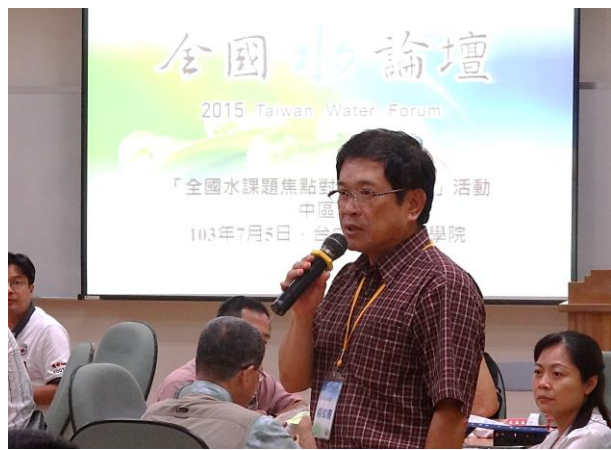
經濟部水利署楊偉甫署長向與會來賓中場致謝