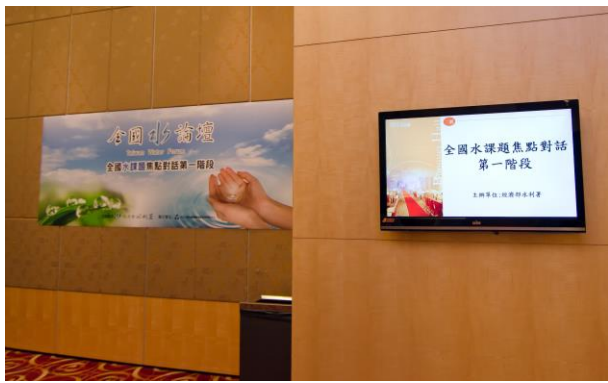
南東區場次於6月21日假高雄蓮潭國際文教會館舉行