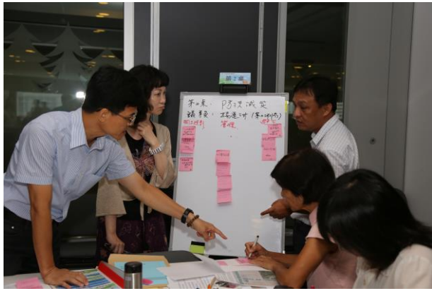
分組討論：桌員熱烈發表意見及討論桌員課題歸類方式(第2桌-防洪減災)