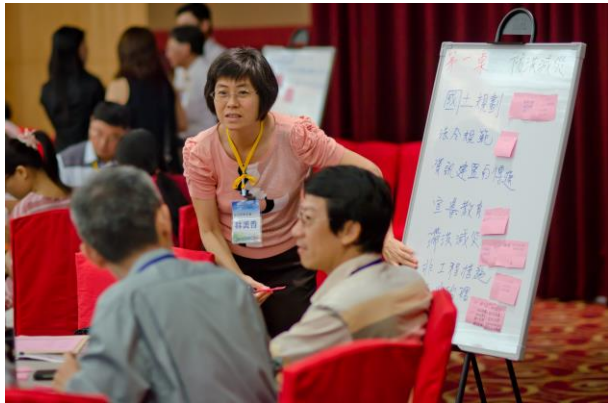
分組討論：桌員發表自身意見，並由議事員協助彙整桌員課題(第1桌-防洪減災)