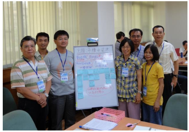
分組合照：桌員課題彙整成果(第 15 桌-永續水資源)