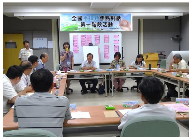
各桌推派之桌代表參與桌代表會議，同時開放與會來賓旁聽