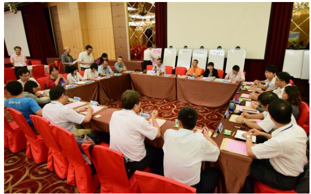
各桌推派之桌代表參與桌代表會議，同時開放與會來賓旁聽