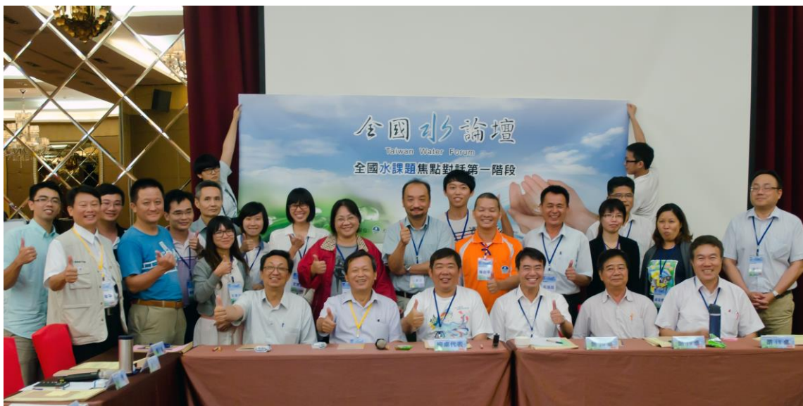
全國水課題焦點對話第一階段南東區場次合影留念，感謝與會來賓共襄盛舉