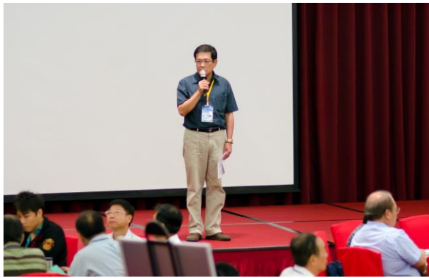
經濟部水利署楊偉甫署長向與會來賓中場致謝