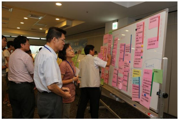
桌代表會議中，將桌次課題再彙整為總結課題