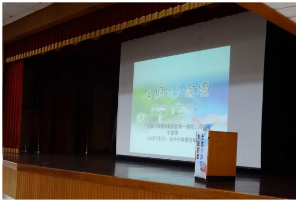
中區場次於 7 月 5 日假台中中華電信學院舉行