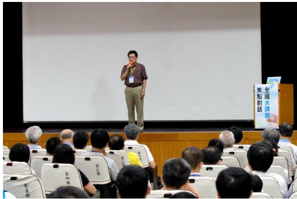
由經濟部水利署楊偉甫署長開場致詞，感謝與會來賓撥空參與