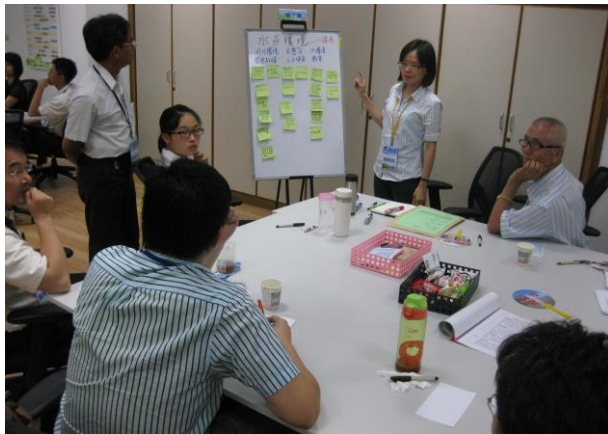
分組討論：桌員進行桌員課題歸類，並說明自身看法(第 7 桌-水與環境)