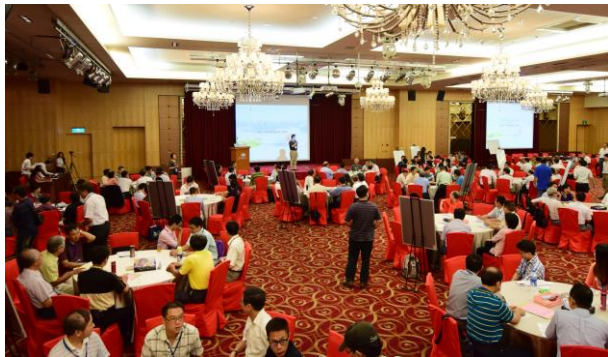
由經濟部水利署楊偉甫署長開場致詞，感謝與會來賓撥空參與