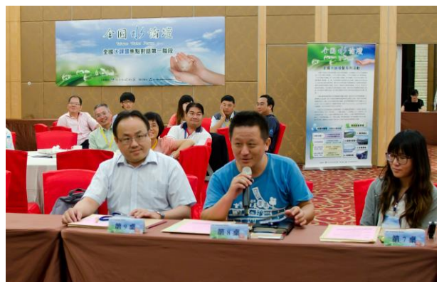
桌代表溫仲良說明桌員提出之課題涵蓋範疇，以利正確歸納