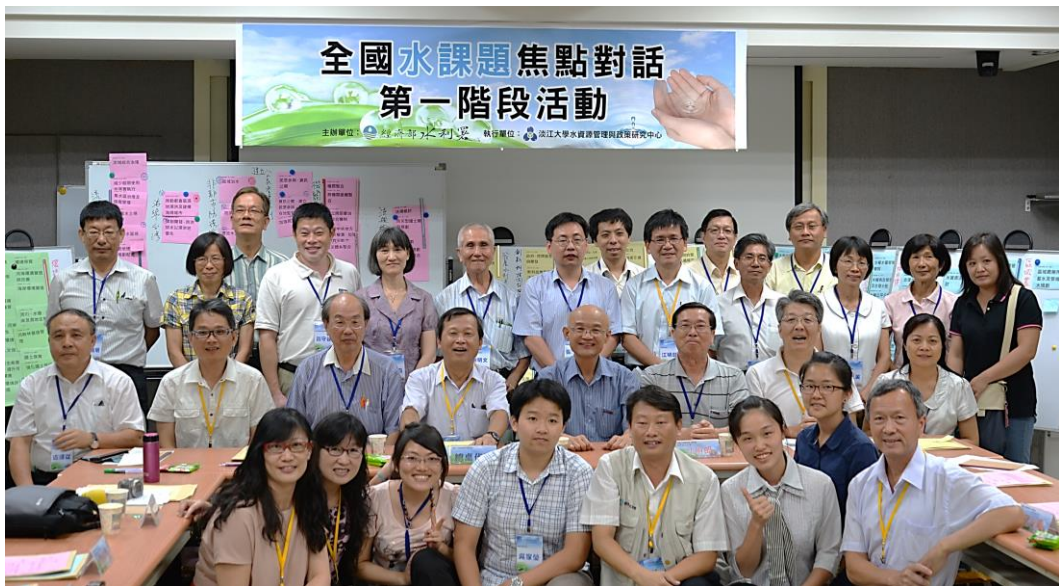
全國水課題焦點對話第一階段中區場次合影留念，感謝與會來賓共襄盛舉