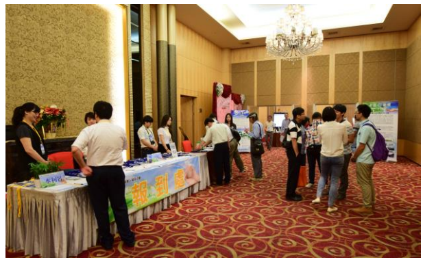
報到處於會場外側，於門口處架設活動看板，以利與會貴賓瞭解活動概要