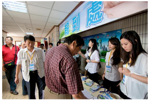
報到處設置於禮堂外側，不僅位置明顯且動線流暢