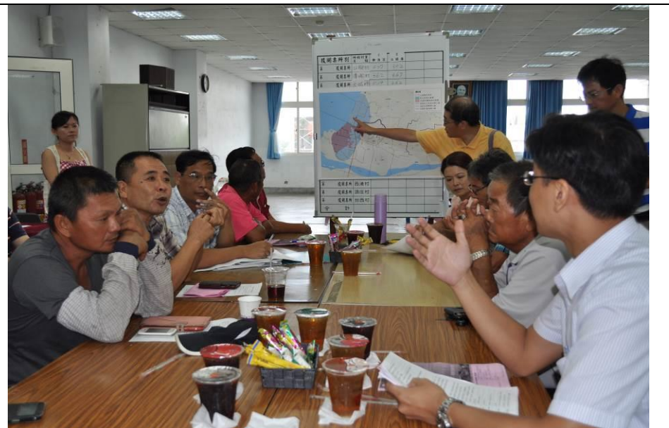
大城地區流域綜合治理工作坊活動照片