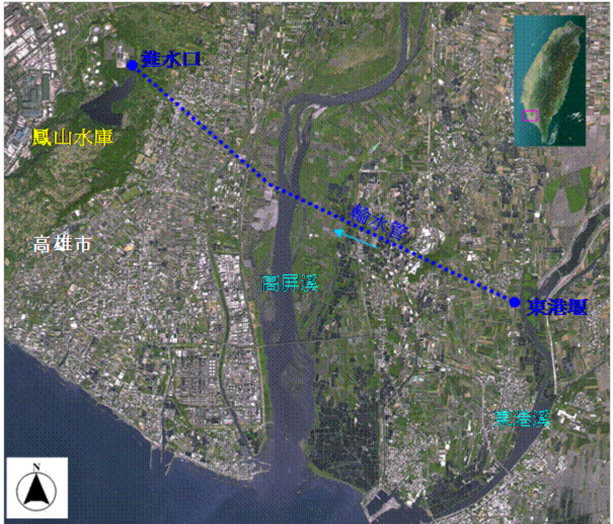
附圖一 鳳山水庫位置圖