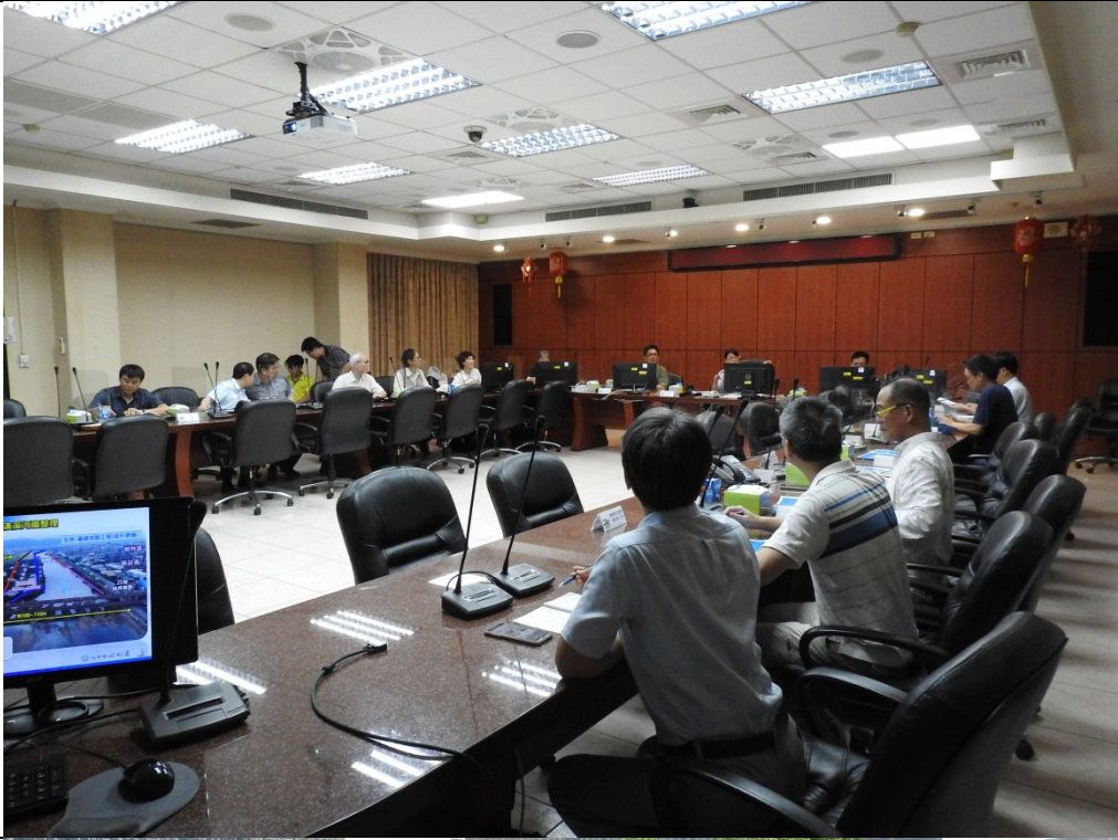
本次會議及踏勘照片：