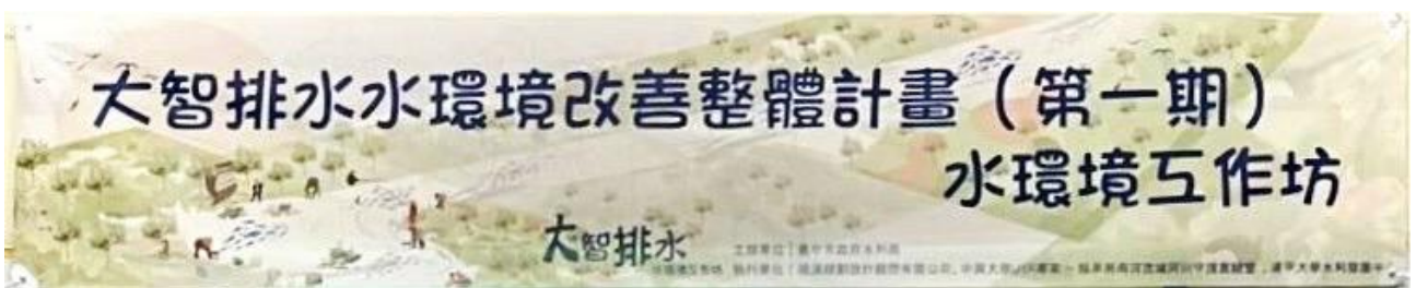
圖 3 大智排水水環境工作坊布條