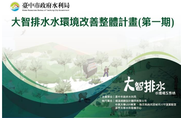
圖 4 大智排水水環境工作坊名牌