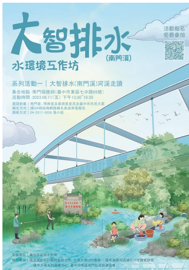
圖1 大智排水水環境工作坊-河溪走讀海報