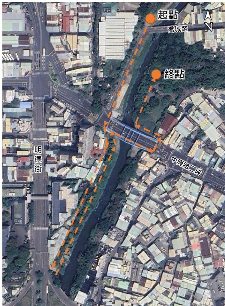
圖 2 大智排水水環境工作坊-河溪走讀路線圖